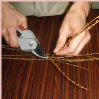
1. 將米柳上端的分枝剪下