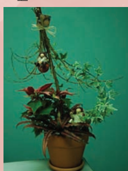
10. 加上玩偶那就更可愛了