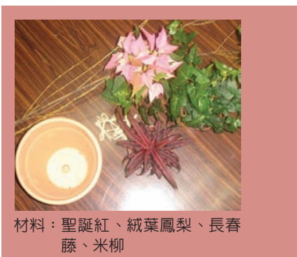
材料：聖誕紅、絨葉鳳梨、長春藤、米柳