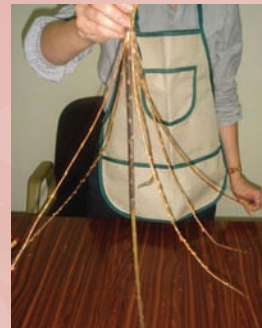
3. 按摩米柳分枝使其呈現彎度往上翹