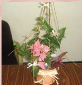
9. 加上兩個咖啡香包當作聖誕禮物後就完成了一棵美麗的聖誕樹