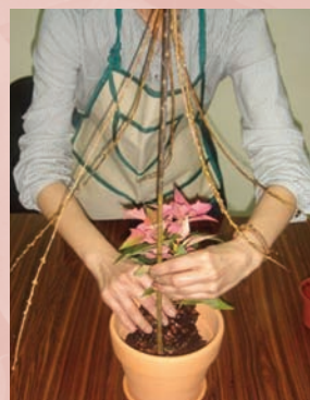
6. 陸續種入聖誕紅，絨葉鳳梨及長春藤