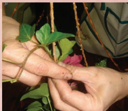
7. 長春藤利用銅線固定攀爬在米柳的細枝上