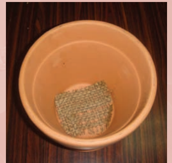
4. 有洞的素燒花器內放一張不織布(或細網)，放一些發泡煉石後加培養土(須和些水)