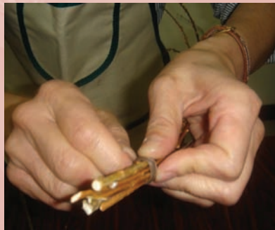
2. 剪一枝較粗的米柳(長度約花器高度的2.5~3倍)米柳長短不一的分枝圍在粗的米柳周圍用透明膠帶固定