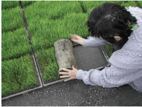
我的戒指。這枚神奇的戒指正發出綠綠的顏色！

裡拿出緊急備用道具袋，將一只戒指穩穩地戴上。我是個全年都穿運動服、牛仔褲當工作服的人，自然不喜歡戴項鍊、首飾等身外之物，但這是一枚非常特殊的戒指，它的神奇在於，戴上這枚戒指後，如果呈現黃色，表示此刻情緒已發出警訊，必須警告自己，放緩腳步；金黃色代表戴著這只戒指的人正處於焦慮中。若發出紅色，代表正處於極度憤怒的情緒中，不宜在此狀況下做成決定。綠色則屬穩定正常；藍色是極度理性冷靜；若顯示黑色，則代表該放下一切，直接到醫院「掛號」了。