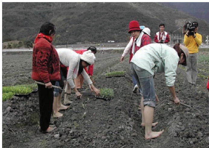
各媒體紛紛報導東吳大學生的活動。