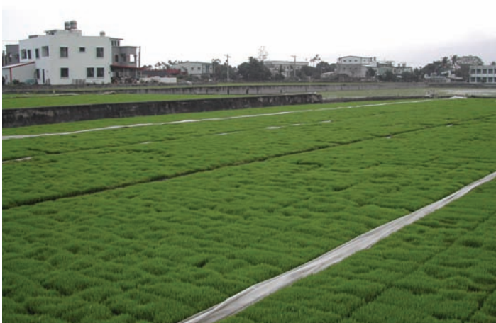
這一片一望無際、綠油油的秧田，仔細看還看到它的凹凸不平。

我想了一下，回過頭來，以一種溫和但堅定的口吻告訴學生：「我們原本預定明天就要回台北了，難得這麼多人聚在一起，又撞上一個令農民心碎的案例，所以今晚大家加班召開稻秧行銷體驗研習會，明天多滯留半天實驗，好嗎？」大夥兒原本已經買了帶回台北與家人分享的土產、行李也早已打包、準備離去前到