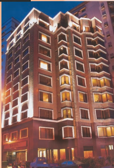
「喜相逢」觀景渡假飯店外觀夜景