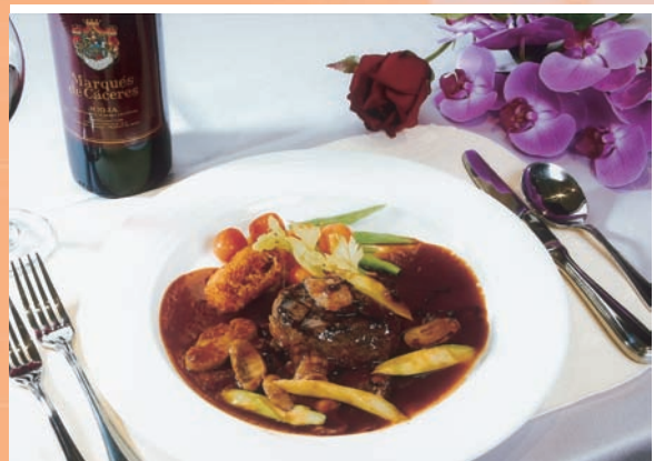
「喜相逢」虹河西餐廳提供餐飲服務