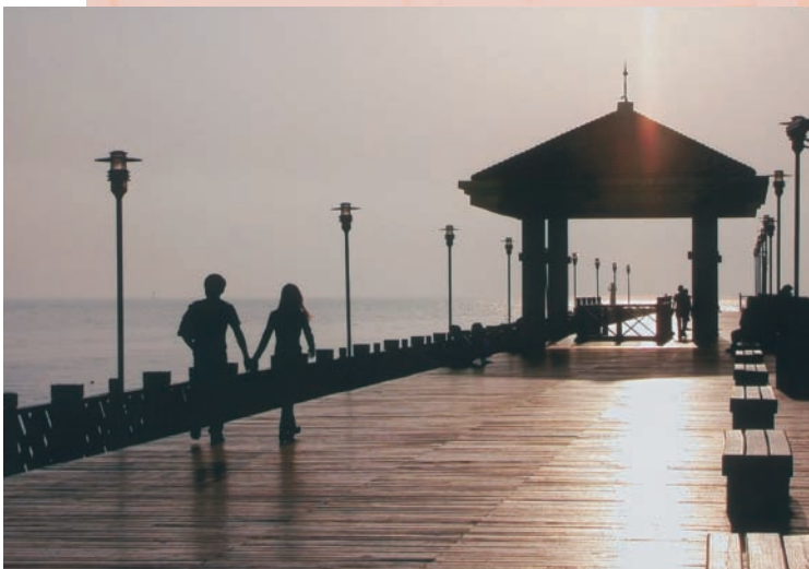
漁人碼頭的「情人道」木棧道