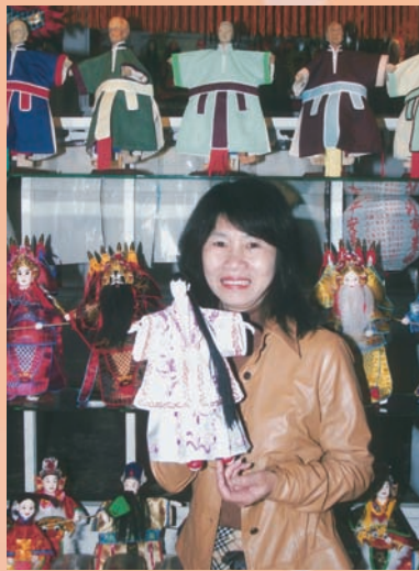
重建街上的布袋戲主題館