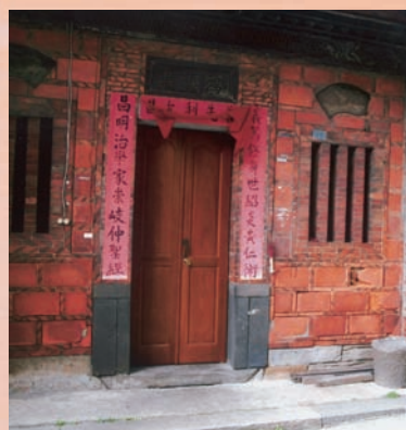
重建街上的布袋戲主題館