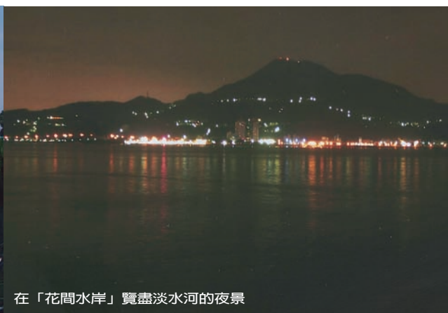
在「花間水岸」覽盡淡水河的夜景