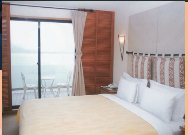
「花間水岸」精緻典雅的客房