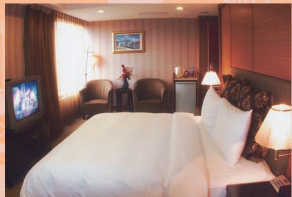
「喜相逢」精緻高雅的客房