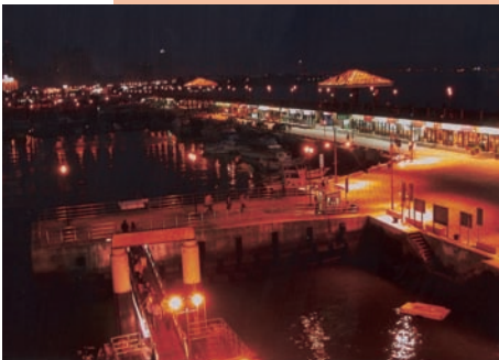
淡水漁人碼頭的夜景