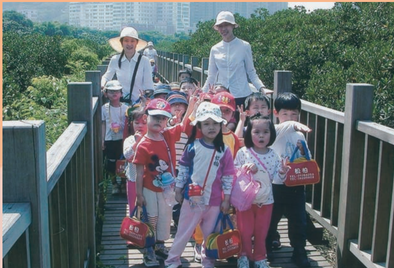
以原木搭建的紅樹林生態步道

淡水河紅樹林自然保留區內，以原木搭建的「紅樹林生態步道」，一路蜿蜒鋪陳，充滿美感又符合自然原味，且刻意設計搭建成居高臨下，您可以慢走細賞水筆仔純林、濕地泥沼生物的「生態之美」。