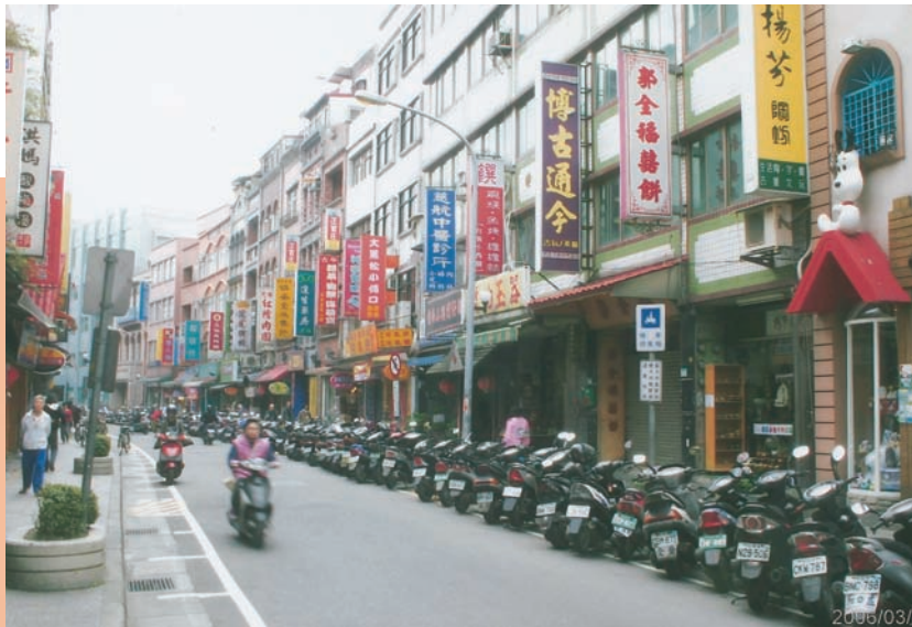
靠近淡水河岸的中正路，商業發展活躍