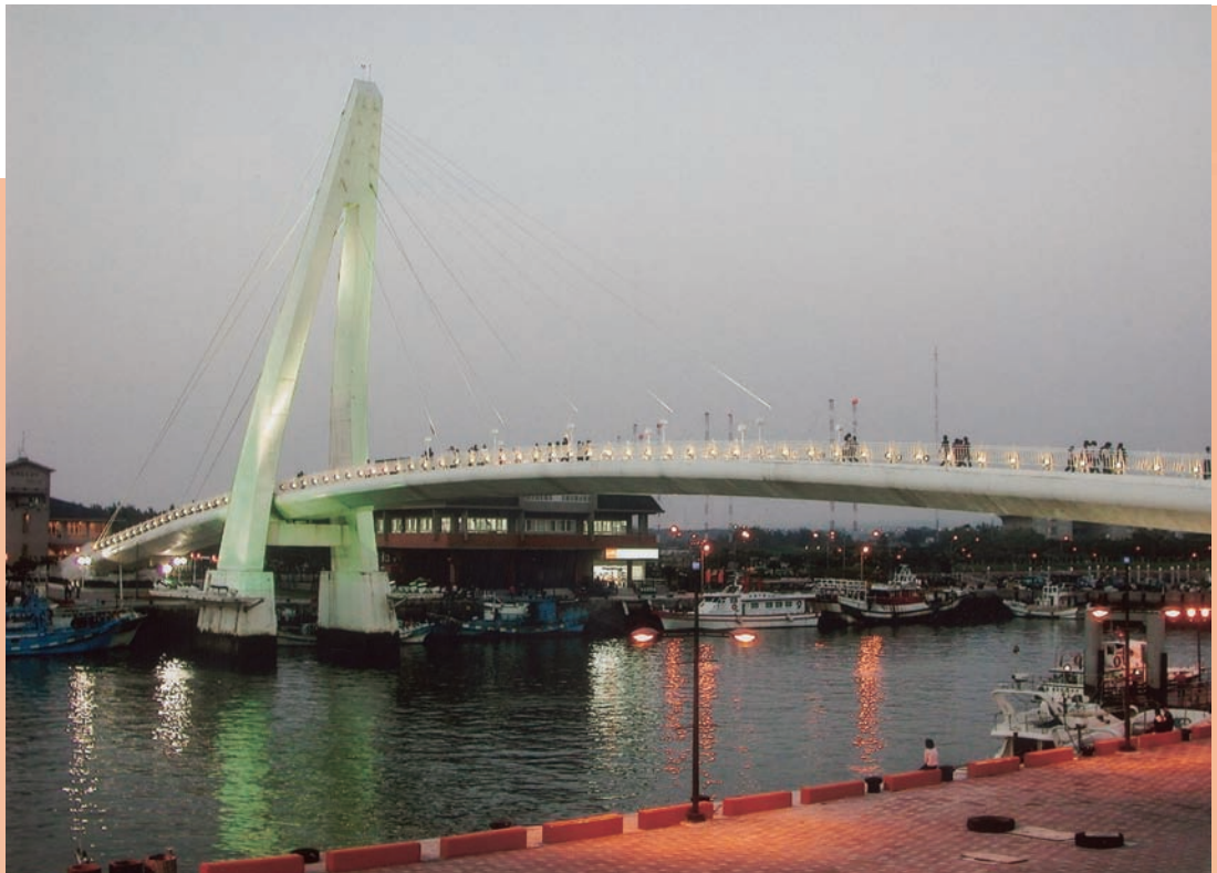
橫跨港區的船型「情人橋」