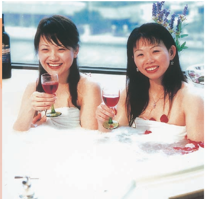
「喜相逢」海景客房備有豪華按摩浴缸