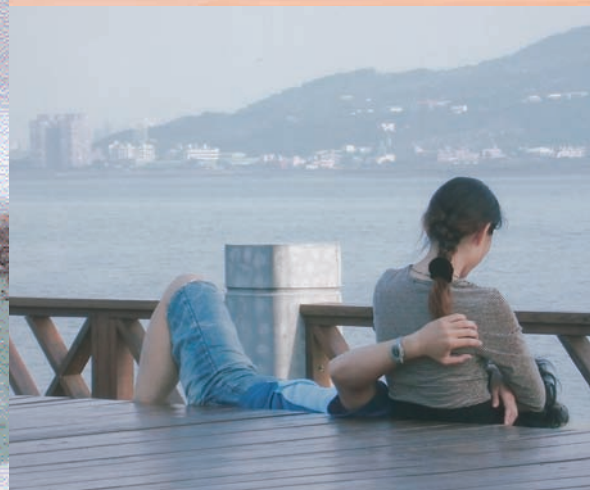
「喜相逢」鄰近淡水漁人碼頭