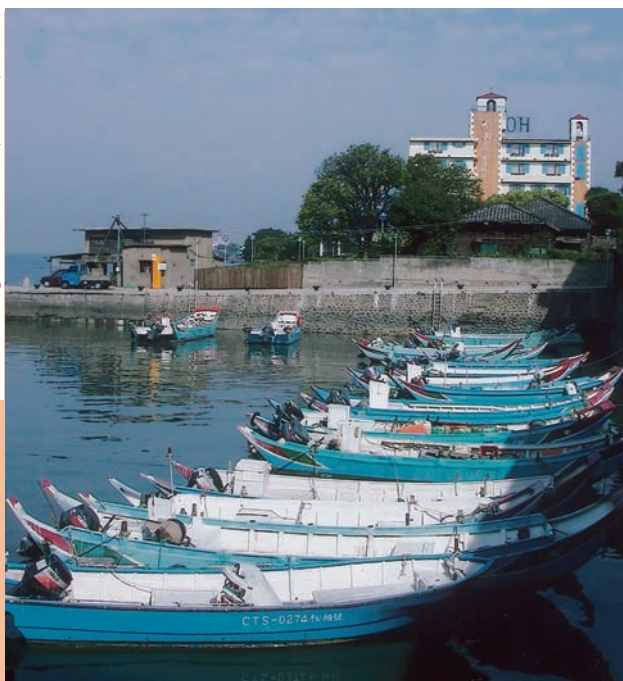
坐落在淡水漁港旁的「花間水岸」