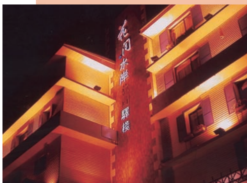
「花間水岸」外觀夜景