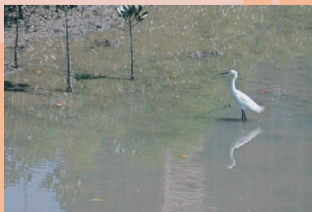
水筆仔純林的生態之美