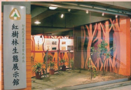
林務局在「紅樹林站」二樓闢設「紅樹林生態展示館」