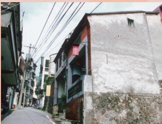
重建街是淡水最早形成的市街