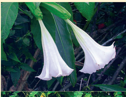
大花曼陀羅的花，毒性較枝葉強