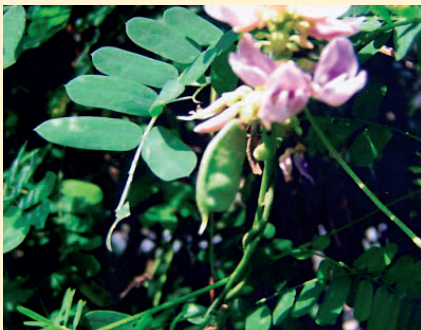
在鄉下，有人種植並收集雞母珠的枯乾葉片作為茶葉泡茶喝

自然界是由許許多的非生物和生物所構成，生物方面包括了植物和動物。然而，有許多的動物是以採食草類植物作為食物，但是有些植物為了保護其生命不受到威脅以致於走到滅亡的命運，本身就會產生一套防衛系統以保護自己，例如本身會分泌一些化學成分讓生物，包括人和家畜造成某些組織器官呈暫時性或長期性的傷害，使動物身體產生不適或致死，諸如此類的植物總稱為「有毒植物」。