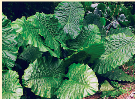
誤採姑婆芋當芋頭食用，導致口部、咽喉和消化道灼熱、腫脹有劇烈疼痛感