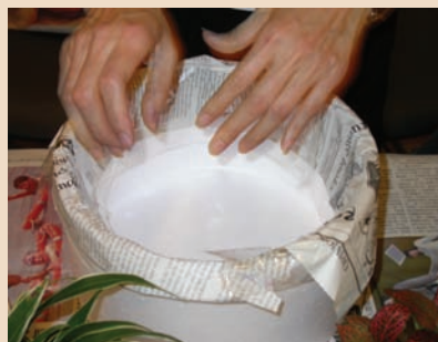
3. 報紙覆蓋好後就不會看到不好看的保利龍