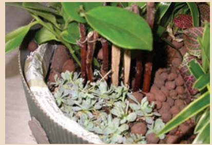
10. 籬笆放上後前面種玫瑰石蓮