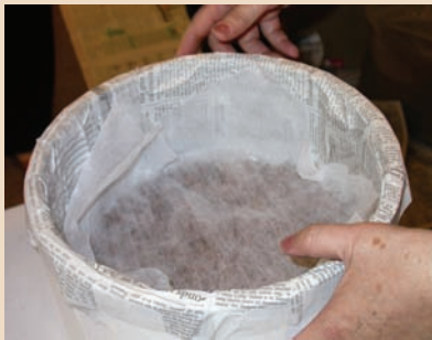
4. 蛋糕盒內放入發泡煉石，上面加蓋一張不織布