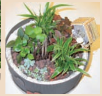
14. 籬笆前的小路徑鋪一些紅磚石，小鳥可愛的家就完成了