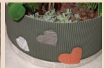
13. 單調的瓦楞紙上作一些色彩的配色