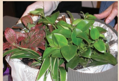
11. 保利龍的蛋糕外殼用瓦楞紙包起來