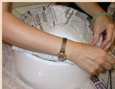
2. 貼著膠帶的英文報紙覆蓋在蛋糕盒邊緣