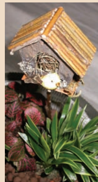
12. 插上一隻小鳥的家