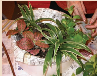
9. 口紅花太大棵時先修剪掉一些