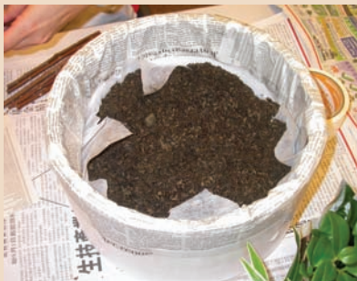
5. 不織布上面鋪培養土