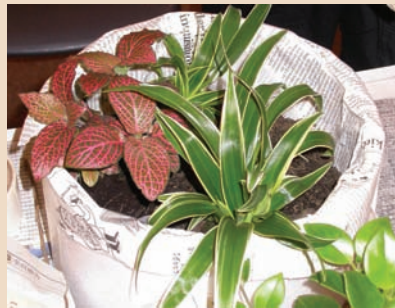
7. 種入紅網紋，白紋草分成兩株一前一後種