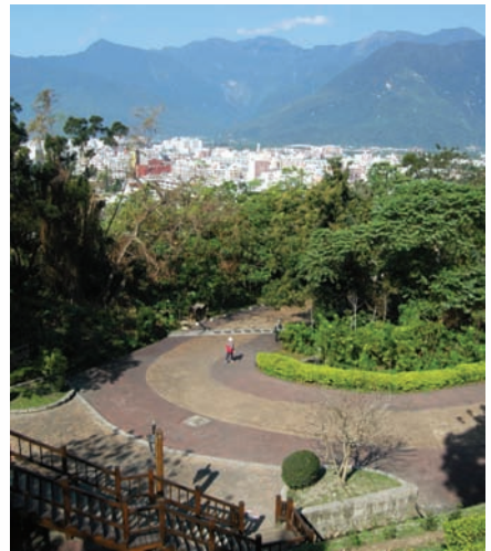
從美崙山生態公園內的木棧道平台眺望花蓮市區

態公園」，是花蓮民眾運動、享受悠閒休閒的兩大去處；而對於外地遊客來說，這兩個公園離花蓮市區很近，不需奔波路遙，穿著輕便服裝、帶瓶罐裝水，就可以簡單、真切地感受在地人的悠閒。