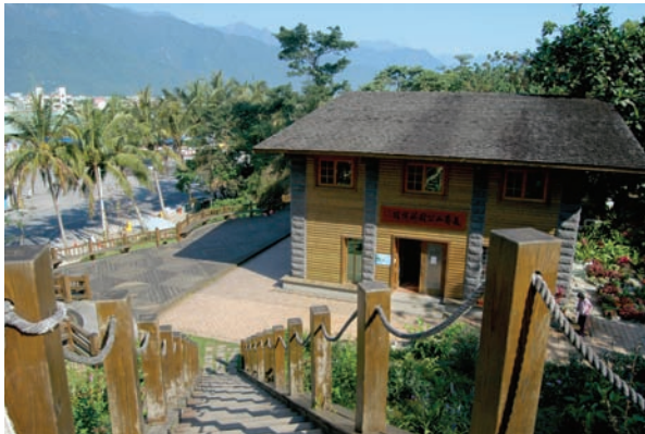
美崙山公園科博館

經過多年來的適度開發與維護管理，現在美崙山生態公園，每天清晨都可看到大批民眾在這裡健走、運動，讓這片山林綠野充滿健康、活力的氣息。即使錯過早起的人群，白天也能看到不少遊客在此留連漫步。而花蓮縣政府在這近幾