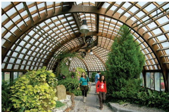
知卡宜森林公園的「龍骨溫室」，曾因龍王颱風而嚴重受創

免讓有「綠癌」、「生態殺手」之稱的小花蔓澤蘭伺機蔓延，除蔓的工作也在符合生態保育的原則下持續進行。