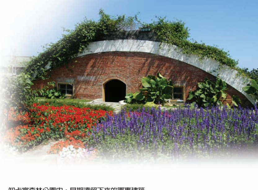
知卡宜森林公園內，早期遺留下來的軍事建築

95年底，花蓮縣政府發表《綠森林的童話—知卡宜森林公園》中英對照專書及導覽摺頁，為知卡宜森林公園又注入一股鮮新的氣息。而同一時間推出的美崙山生態公園導覽摺頁，在意義上，頗有引領遊客在悠遊園區的時候，也能夠從生態教育的層面，用心體會自然生態演替與成長奧秘的意味。而這也是農業局林務課所期許的目標。