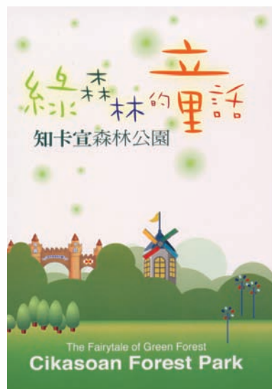
《綠森林的童話》專書，引導讀者深度走訪知卡宜森林公園

95年底，花蓮縣政府發表《綠森林的童話—知卡宜森林公園》中英對照專書及導覽摺頁，為知卡宜森林公園又注入一股鮮新的氣息。而同一時間推出的美崙山生態公園導覽摺頁，在意義上，頗有引領遊客在悠遊園區的時候，也能夠從生態教育的層面，用心體會自然生態演替與成長奧秘的意味。而這也是農業局林務課所期許的目標。