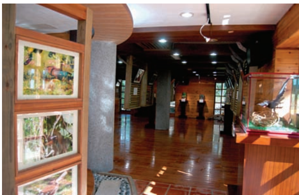
美崙山公園科博館內的生態展覽，讓您在優美情境當中，也能獲得知性的滿足

年，也在生態展示館進行螢火蟲的復育。所以，在美崙山典型的亞熱帶雨林裡，不但有烏頭翁、綠繡眼、五色鳥、赤腹松鼠，以及多種甲蟲、蝶類、爬蟲類和兩棲類，在美崙山的夜裡，也能看到閃爍的點點螢光。