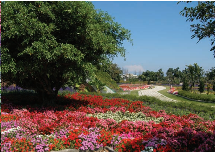
知卡宜森林公園內，賞心悅目的園藝景觀