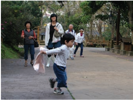
每天早晨，在美崙山生態公園都可以看到很多民衆來這裡活動筋骨

美崙山與知卡宣2個公園，在2005年曾因強烈颱風肆虐而滿目瘡痍，花蓮縣政府農業局林務課，以工程減量、不擾動生態的原則，讓山林在順應自然循環的機制下，回復生意盎然的樣貌，也讓人們學習到有關生態自然循環的一門課。