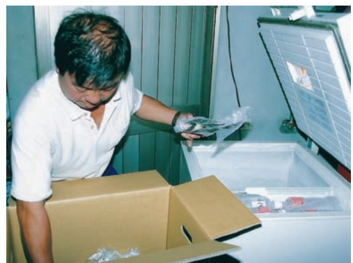
台灣鯛以冷藏方式運輸到市場或客戶手中