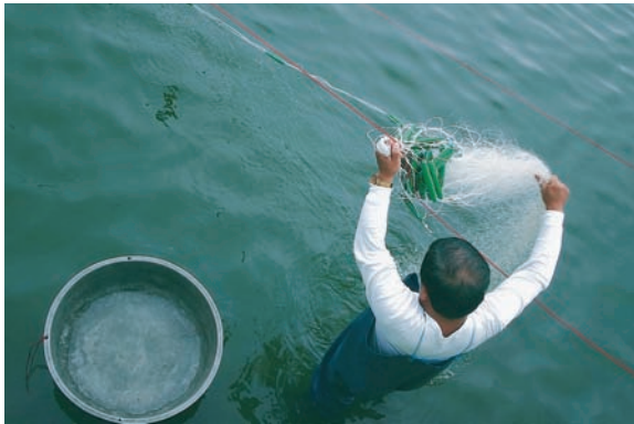
逐一拆下網獲的台灣鯛