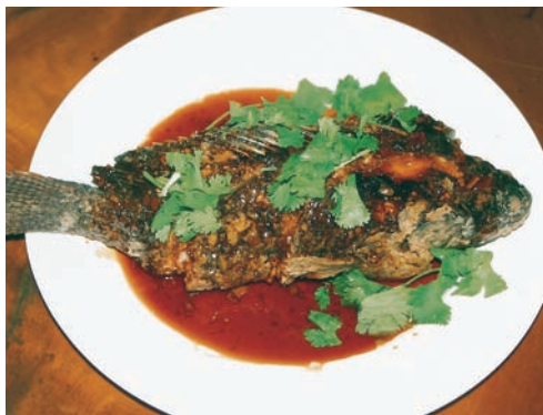
紅燒 （大愛農場/製作）