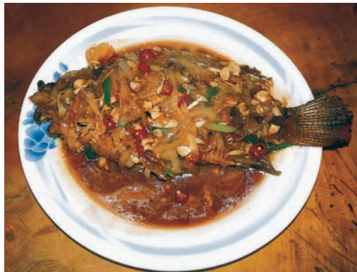
糖醋（大愛農場/製作）