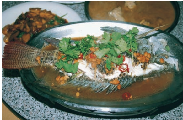
清蒸（大愛農場/製作）