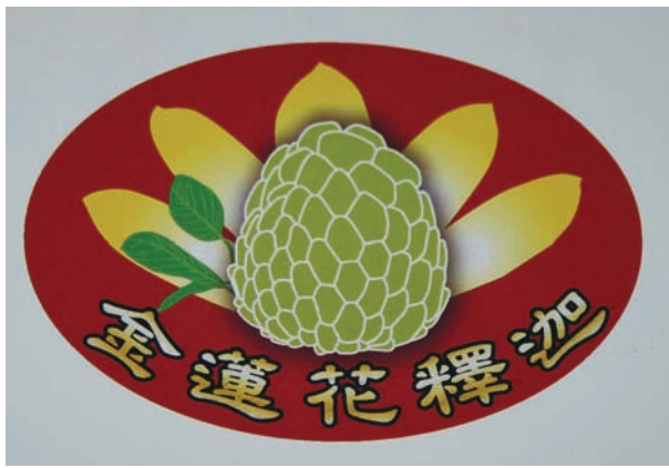
蓮花釋迦品牌標誌

的；自創透明塑膠套袋，容易識別果實是否可採收。產品以「世界美」的品牌行銷，並於東河鄉農會架設網站銷售。