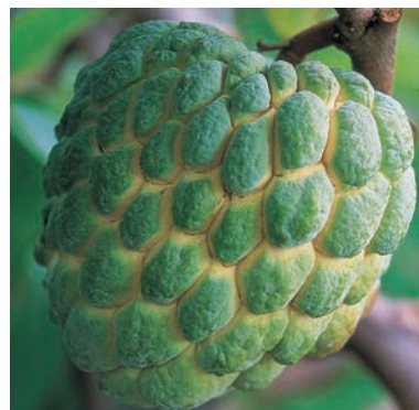
釋迦新品種－黃金釋迦