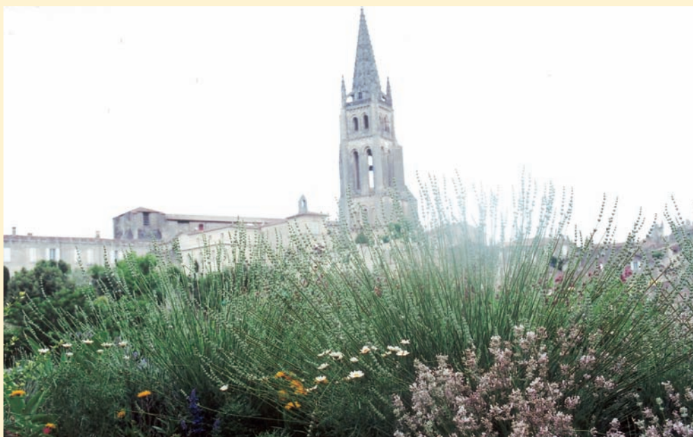
聖艾美農城內，國王城堡主塔下面之香草及花卉植栽