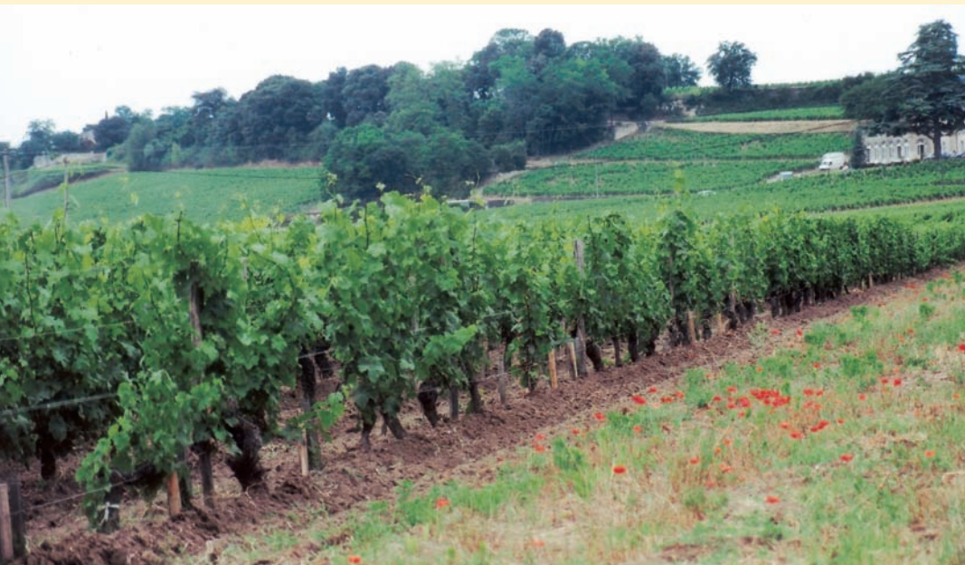
聖艾美農城外之葡萄園，6月盛開的罌粟花點綴其間

莎拉小鎮的火車站廣場有一植栽區，除薰衣草外，還有一種開藍紫色小花的濱藜葉分藥花—藍塔( Perooskia atriplicifolia ，“Blue spire”)，外觀遠看和薰衣草類似，做為花壇內植栽，極為醒目。廣場旁有家園藝資材店，販售蔬菜、花卉、香