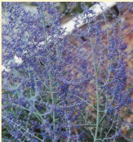
外觀很像薰衣草的濱藜葉分藥花(藍塔)

草等種子及幼苗與相關材料。莎拉為一具中世紀與文藝復興時期建築風格之小鎮，以鵝肝、鴨肝及核桃等為其特產，值得一遊。