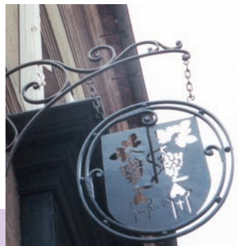
葡萄酒專賣店店招