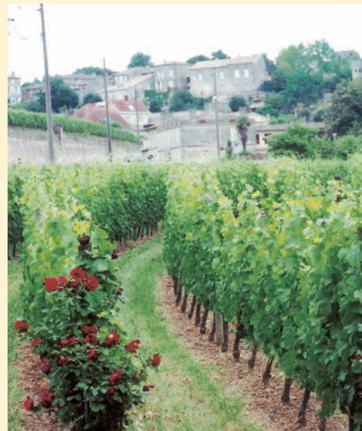
聖艾美農城外之葡萄園，栽植玫瑰做為誘引昆蟲植栽