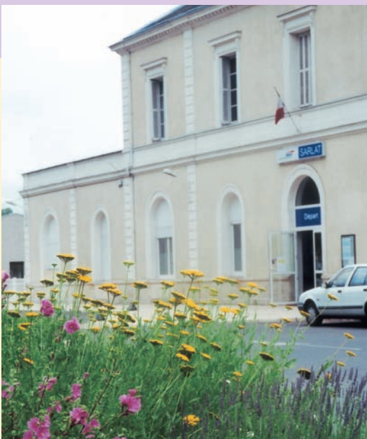
莎拉火車站前廣場之香草花卉植栽