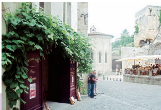
聖艾美農城內，主教堂附近之葡萄酒專賣店是國人的最愛