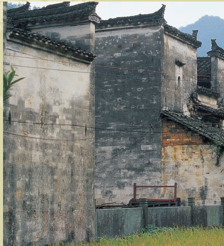
古色古香的徽派建築

而家家户户門口還插著有如古裝片場景的旗幟或紅燈籠，餐廳就掛一個「酒」字、賣竹器的掛個「竹」字、木雕店掛個「木」字、賣