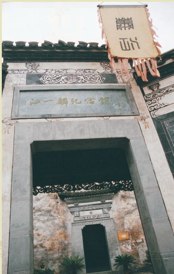
門口插著「蕭江」旗幟的江一麟紀念館