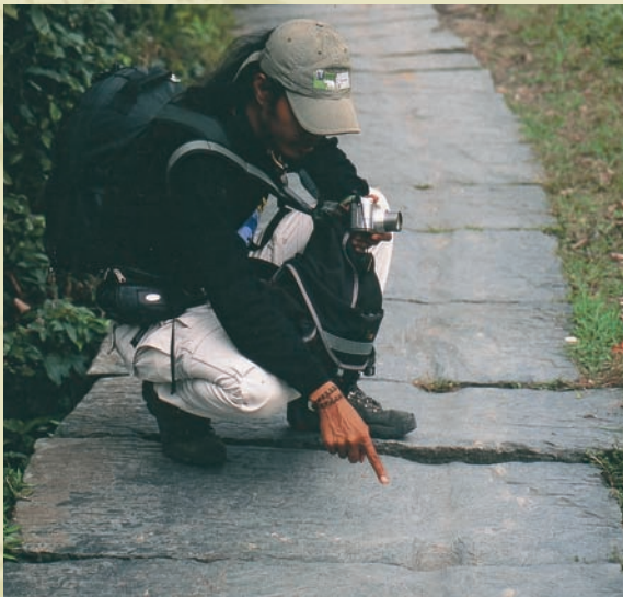
獨輪車輾過的歷史軌跡