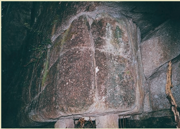
一圓一方小石就能頂住一座山峰，是大鄣山一奇景