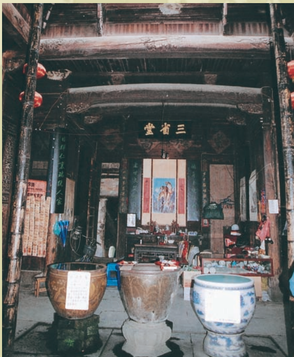
保存完好的三省堂及堂前三只太平缸

分科學，小井水為洗滌用；大井水清澈涼冽、甘醇可口，純為飲用，源源不斷的井水歷經千年，不知哺育過多少代村民。而井名乃源於李白的「舉杯邀明月，對影成三人」之詩意，因每當月圓之夜大小兩井中各映出一輪玉盤，美極了。但最美的還是上、下村間的那片田野，我們由下村進，進去後才知此村分上、下兩村，由下村到上村需走十來分鐘，吸著四野靈氣、繞著羊腸田埂走呀走，無意間一回頭，哇！被拋在身後地勢較低的下村，整片白牆黑頂襯著藍天綠野真是迷人，而人在畫中的感覺真好！