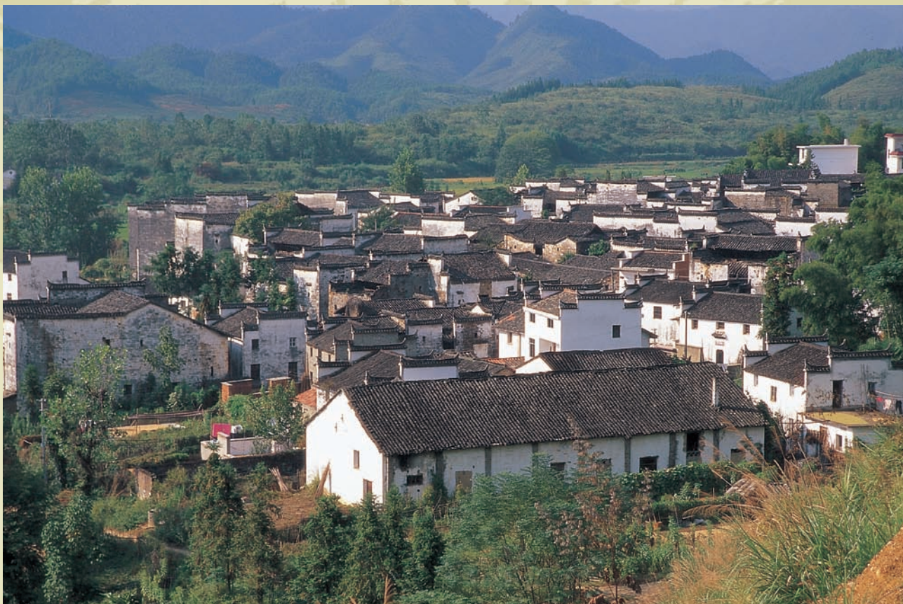
黑瓦白牆綠樹，中國最美的農村—婺源

穿過門樓牌坊，村道兩旁除了大紅燈籠高高掛，還到處飄著旗幟，上面都繡著蕭江二字，聽說此村始建於唐，最初有藤、葉、鮑、