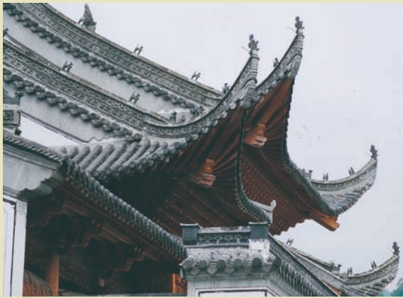
蕭江祠堂屋頂上的神獸