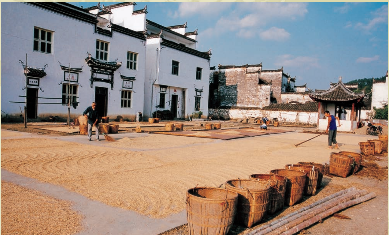
古農村一角的晒穀場