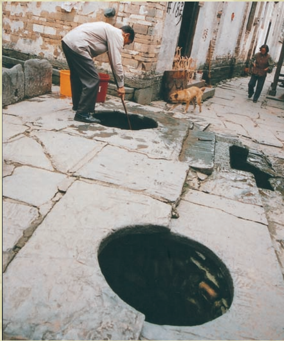
「曉起」下村的映月雙井