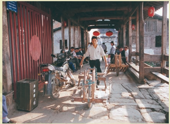
獨輪車在思溪古橋上忙碌