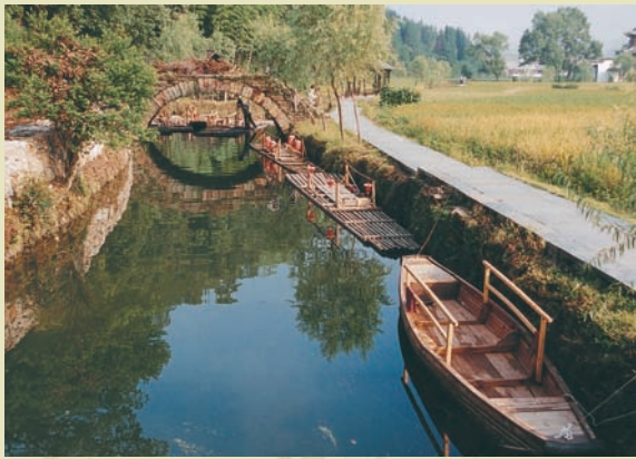
「李坑」是沿著小溪形成的聚落