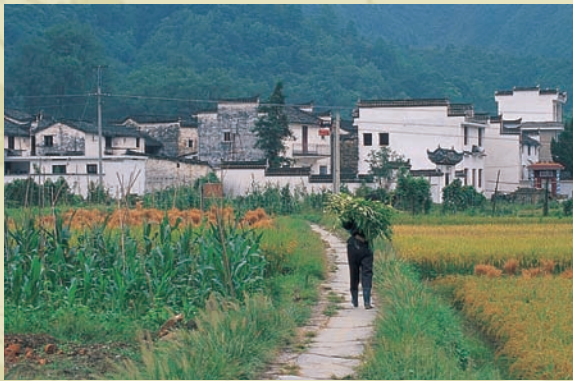
回頭再看一眼「曉起」下村