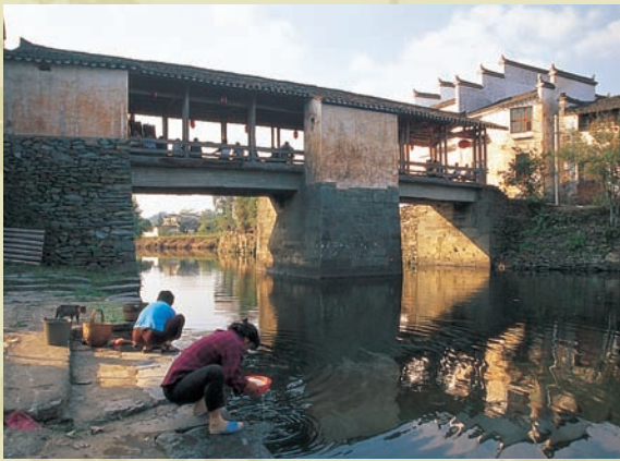
思溪橋下的常民生活