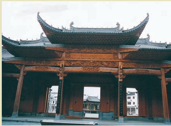
蕭江祠堂木雕門（內面）

戴等姓人家在江灣河灣處聚居，當時稱雲灣，北宋時蕭江祖先遷入，漸成巨族而改名江灣，所以蕭江原是一家人。