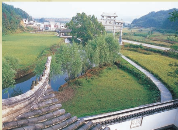
充滿靈氣的「曉起」村