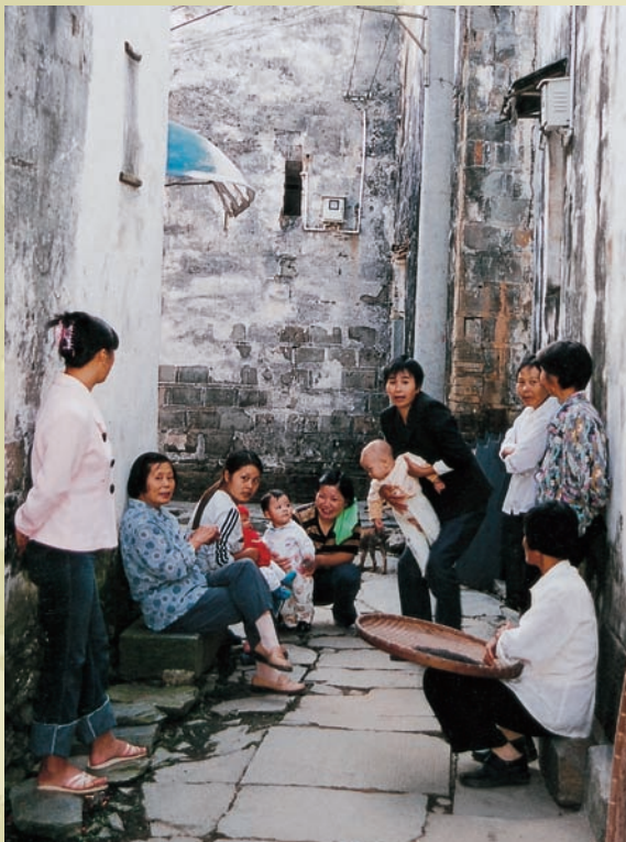
古樸巷弄內的悠閒時光

在舊的史誌上記載大鄣山是「鐘靈發脈之地」，後人乃引申為「婺源之源」。綿延千里的鄣公山脈，山體由絳紫色的花崗岩構成，90%以上覆蓋森林，而3.5公里長的峽谷內瀑布成群，據說大小有82條白瀑與綠潭交相輝映，還有幾座吊橋點綴其間，所謂滿山古木、滿谷靈泉、加上迎面清風，就算谷中山路全是巨石坎坷，但一路下來就像在一幅幅的潑墨山水畫中徜徉，走了一個半小時也不覺累，上山可就要多一個小時以上了。