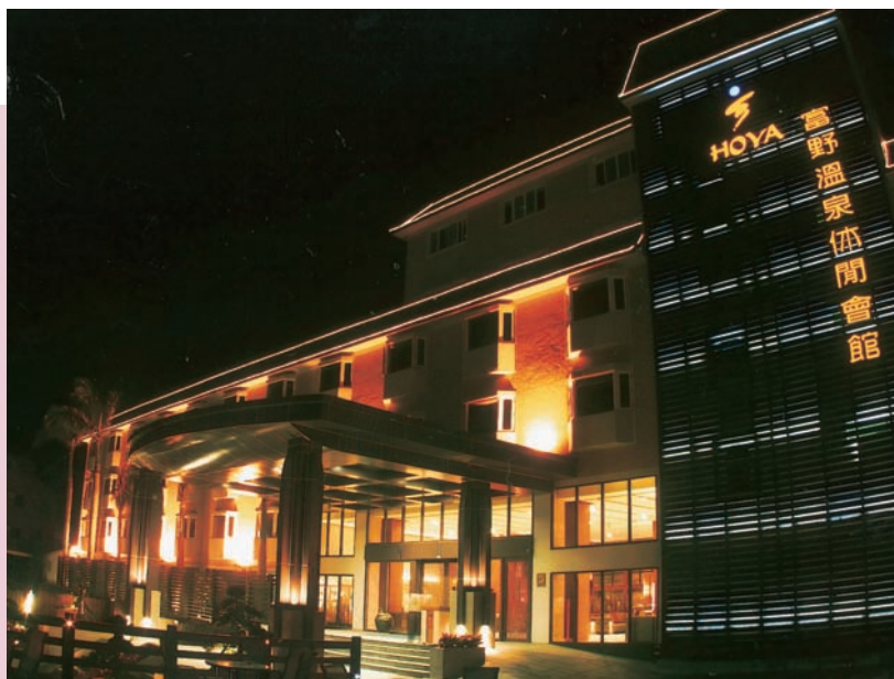
夜晚的富野溫泉休閒會館

休閒渡假時，若能泡個暖呼呼的溫泉，應該是件最幸福、最快樂的事。位於台東縣知本溫泉風景區的「富野溫泉休閒會館」，於今年春天隆重開幕，正向喜愛泡湯的朋友熱情招手。