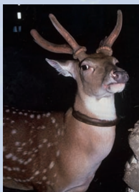
綠島居民養殖的梅花鹿