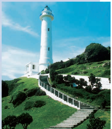
具有歷史意義的綠島燈塔

將軍岩—係由幾塊火山爆發留下來的熔岩屹立在海邊而成，遠遠望去，彷彿叱吒風雲的披甲戰將，揮軍陷陣，為一海灘奇景。