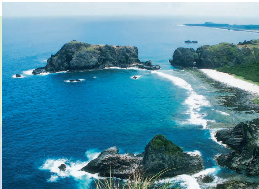
海崖下的睡美人與哈巴狗

生。近年來，隨著交通的改善，以及國民遊憩需求日增，綠島的神秘面紗逐漸褪去，綺麗的風貌，也開始為世人所矚目。