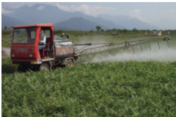
噴藥車正為瓜藤噴灑友善微生物，可不是在噴灑農藥喔！

在行銷方面，除了發展產地直銷及宅配通路之外，今年夏天在台北、台中的松青超市，以及好市多、家樂福等大賣場也買得到花蓮西瓜。不