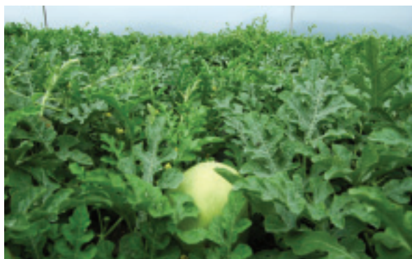
西瓜田裡的幼瓜，在瓜農的悉心照料之下一天天長大

在氣候方面，花蓮的氣溫雖不比南部高，但西瓜生長環境的平均溫度卻不遜色。瑞穗鄉農會總幹事魏清河表示，花蓮第一期瓜的成長期間，經過日曬的砂礫地讓地溫升高不少，第二期瓜的成長期，又正好在酷暑季節。所以，以平均溫度來說，非常符合西瓜的生長要求。而在花蓮西瓜最北產區的壽豐地區方面，壽豐鄉農會則利用氣候溫和的特性，讓西瓜慢慢熟成，造就細緻的口感，也創出獨樹一幟的風格。