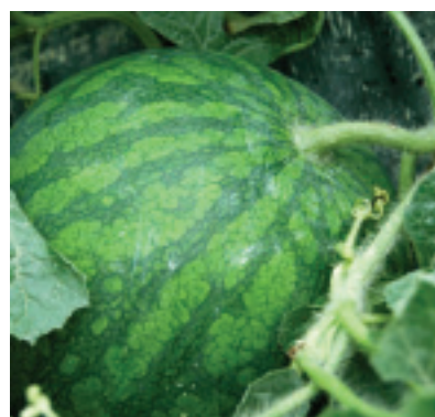
對環境十分挑剔的「無子西瓜」

當您來到賣場、市集，看到個個渾圓飽滿的花蓮西瓜，別忘了認明品牌和標章，也別忽略了這些都是瓜農們用心栽種的結果哦！尤其，今年花蓮的瓜農們抱持求好心切，不計成本全面採用有機肥的態度，就值得您用實際的購買行動大力支持！而那一份爲了種出最頂級西瓜，只要聽聞可以增進品質的方法，都可以比平常事還要認真的執著，也顯出農人的耿直和誠懇，不只是耕作養活百姓的理念，也包含了讓更多人能吃到他們用心栽種的西瓜的期許。不妨現在就出門去，買顆花蓮西瓜，做爲您今夏最佳的消暑聖品吧！