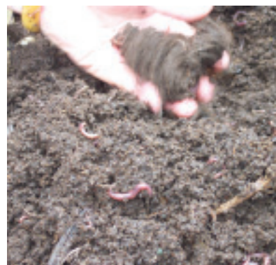
培養友善微生物的蚯蚓飼育箱