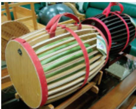
今年壽豐鄉農會推出的「果艷西瓜」橡木桶新包裝，精緻又大方

段再分枝的「子蔓」，因會結出瘦長形狀的西瓜，甜度、脆度都不好，所以必須砍除。不但如此，幼瓜結出之後，還必須把不好的幼瓜篩除，以講究西瓜的品質。通常「華寶」每株只留1粒；無子西瓜每株只留2至3粒。