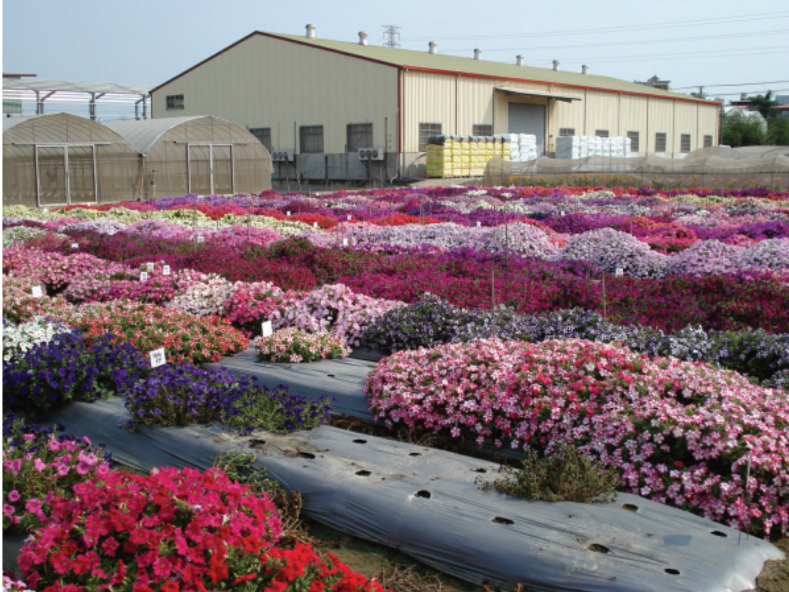
農友種苗公司「鳳山研究農場」滿園花團錦簇的矮牽牛

貢獻，聽到當地人說「農友」公司比台灣政府更 有用」。陳爺爺回應說，他的日籍老師曾對他說 「東南亞的農民是很可憐的一群，若以後有能力 要多幫助他們。」這樣的告誡一直深記在他的心 中。原本要將「農友」的優良種子及種植技術引 入緬甸，卻因外國政治力干預而作罷。