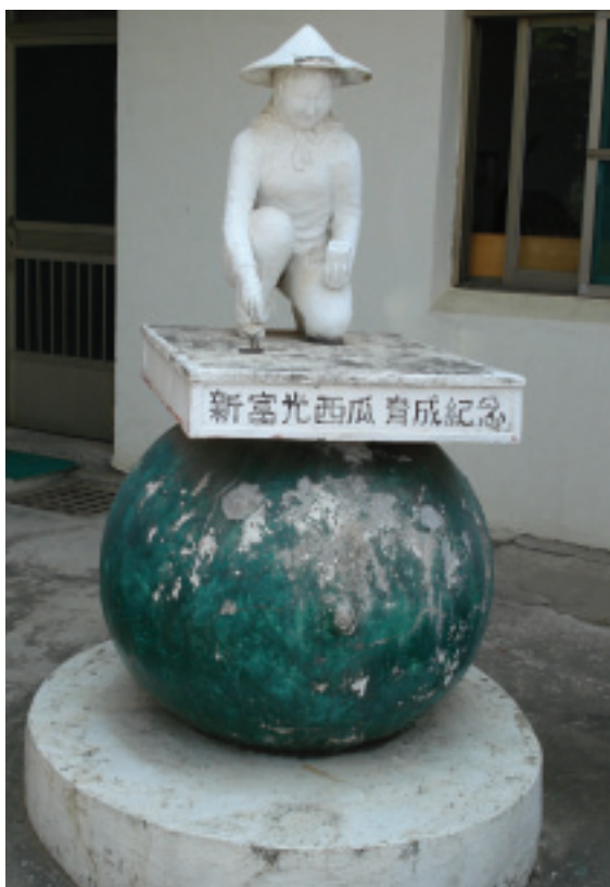
「鳳山研究農場」大門前斑駁的西瓜育成紀念塑像，上方的農婦是對辛勤農民的敬重