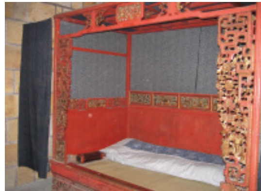
民俗文物館內之展示