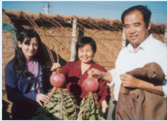
剛出土的新鮮蘿蔔