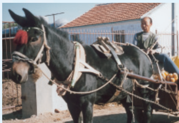
農民趕著去市場賣玉米，是鄉間常見的牲畜交易市集