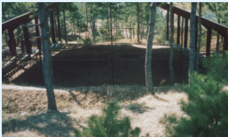
女神廟是紅山文化的精髓

被列為中國考古五大發現之一的牛河梁紅山文化遺址，從1993年開始有計畫發掘以來，已先後發現深受世人矚目的女神廟和積石塚等文化遺址點20多處。紅山文化代表中國北方地區史前文化的最高水平，將中華文明史推前1,000多年，使夏以前的三皇五帝傳說，找到了