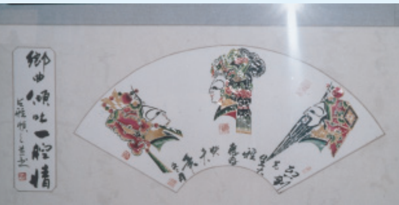
凌源皮影與剪紙，堪稱一絕