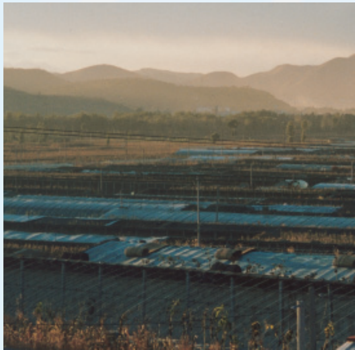
綠色食品生產基地

經過鄉間市集裡，巧遇農民們正在忙著買賣牛、馬、騾、驢等牲畜。凌源市的大牲畜交易市場，已有近百年的歷史，每個交易日平均能成交3千多頭牛，一年交易數量約30萬頭牛。