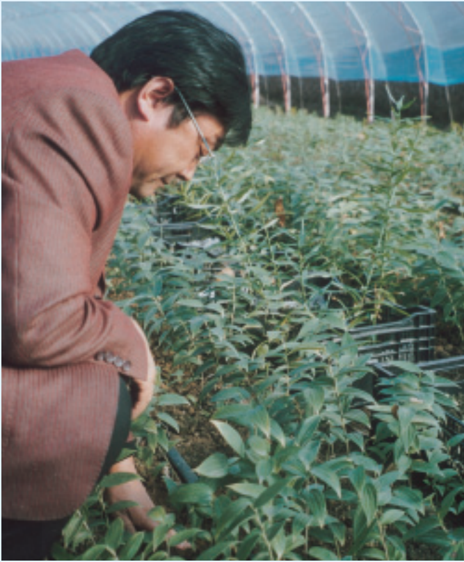
農業專家指導花卉生產