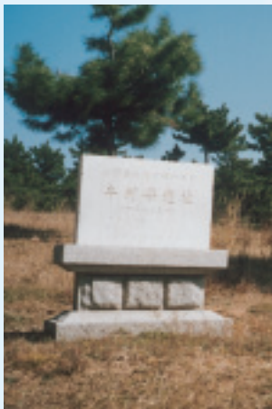
紅山文化的牛河梁遺址

實物依據，對上古時代社會發展史、思想史、宗教史和美術史的研究產生重大的影響。許多海內外專家學者稱此地為「五千年前的哲學王國」、「原始宗教聖地」和「遠古玉器中心」，可與埃及金字塔古文明相比的世界性發現，此遺址現已申報世界文化遺產。