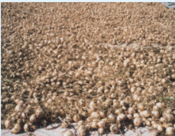
凌源生產的百合種球

近年，凌源市已逐漸成為國際重要花卉基地之一。凌雲花卉產品廣受中外市場歡迎，國際花卉專家認為，凌源花卉養分累積豐富，成球好，花莖粗壯、花朵大、花期長，並且色彩純正，頗受消費者喜愛。此地是遼寧自繁品種鐵砲百合種球，以及凌源自繁品種亞洲百合種球、二代三代百合種球的繁育基地。這些種球種性優良，抗病性強，品種多樣，價廉物美。