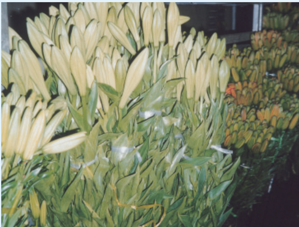
凌源生產優質百合

農業標準化可使農產品增加競爭力，提升生產效率，增加經濟效益，促進農民收入。凌源市的無公害小黃瓜與花卉，已獲列中國農業標準化的一類示範區項目名單中。近年加緊制定了農產品標準系列規範，如「無公害蔬菜保護地生產農藥使用準則」、「無公害蔬菜保護地生產肥料使用準則」、「無