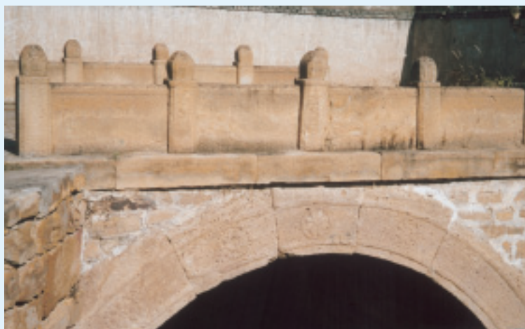
保護完好的金代石拱橋

實物依據，對上古時代社會發展史、思想史、宗教史和美術史的研究產生重大的影響。許多海內外專家學者稱此地為「五千年前的哲學王國」、「原始宗教聖地」和「遠古玉器中心」，可與埃及金字塔古文明相比的世界性發現，此遺址現已申報世界文化遺產。