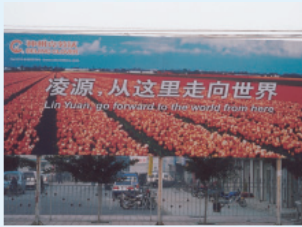
凌源花卉產業邁向國際化

公害黃瓜保護地生產技術規範」，進而包括行銷管理層面的「農產品批發市場管理技術規範」等近30種規範，從生產到管理與行銷，皆要求做到國家一級的高標準規範。「棚內種菜、花棚旁種果樹、果樹底下種藥材」等先進的土地利用模式，已在凌源市大規模推廣。