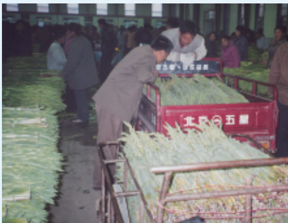
清晨4點的花卉拍賣市場