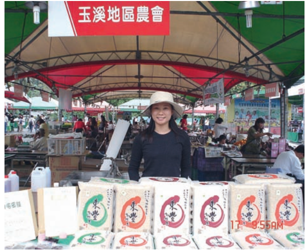
配合農政單位參與農產品展售活動

的液體，它除含有醋的成分外，尚含有許多種有機物和一些微量元素，如與黑糖酵素液混合後，使用效果會更佳。糖醋液與木醋液施用水稻上，主要有抑制徒長、防止倒伏、減緩稻株老化、防治稻熱病，或增強稻株抵抗其他病蟲害之功能。通常，施用糖醋液或木醋液之稻株，都會顯得較一般稻株乾淨清爽，直到稻穗成熟採收時，穗稈往往還保持青翠綠意。