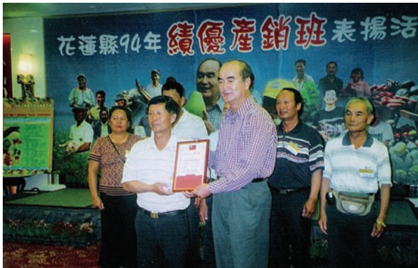
94年被評選為花蓮縣績優產銷班