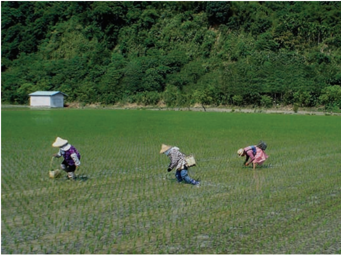
有機稻生長期以人工補植秧苗的情形