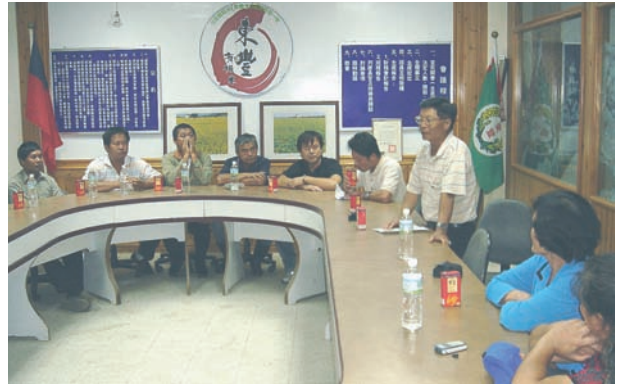
玉里鎮稻米產銷班第一班定期召開班會