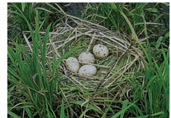
野鳥經常在稻田裡築巢生蛋

高，煮熟後吃起來，有粗糙、生硬的感覺；而稻田若缺乏矽酸成分的土壤，稻株容易生病，結穗情形就差了些，也會在碾製過程中增加碎米粒；又如稻田欠缺有機肥，米粒的外貌與色澤，就較不光潔、明亮。因此，可運用稻穀殼、綠肥、堆肥，以及牲畜的廢肥來栽種稻米，更藉此改善稻田的土壤性質。