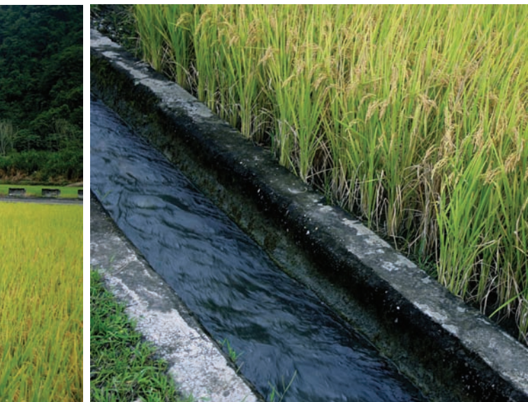
利用渠道引進沒有受過污染的山溪水灌溉稻田

「糖醋液」乃是一種以黑糖酵素液與釀造醋混合而成之葉面噴灑劑，其中醋的作用，有殺菌與殺蟲的效果，而其醱類則有調節植物生理之功能。「木醋液」為乾餾木材或稻殼所獲得主要成分為醋