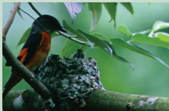
灰喉山椒鳥雄鳥育雛

特有生物中心為配合林務局推展社區林業及生態旅遊的需要，近年來選擇在南投林區管理處奧萬大國家森林遊樂區及東勢林區管理處八仙山國家森林遊樂區進行鳥類繁殖生態的長期監測，同時也對台灣特有鳥類的生態進行影片拍攝。今年7月已經合作出版「赤腹山雀的巢箱生活」影片DVD一部，12月底南投林區管理處將有一系列的「鳥類秘密生活全紀錄」生態影片陸續完成，將台灣特有鳥類的秘密生活逐一展現。