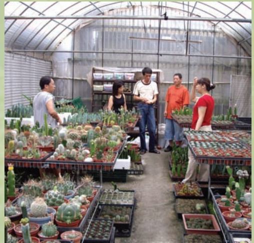
溫室中不時會有一些仙人掌同好前來切磋交流