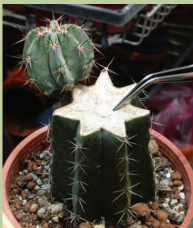
台木的中心有維管束，是仙人掌嫁接成功與否的重要關鍵