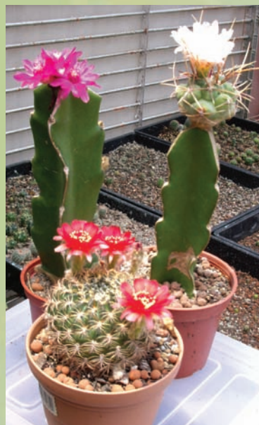
仙人掌的花色鮮豔，且在中午愈熱時愈開花