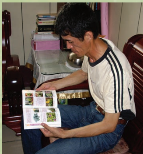
書中資訊是張世民豐富的仙人掌知識的來源