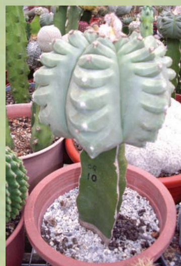
龜甲變鳳玉具有特殊形體