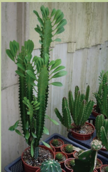
麒麟木類是仙人掌科中唯一還保有葉片構造的仙人掌