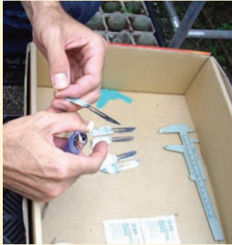
嫁接前「手術刀」要先消毒