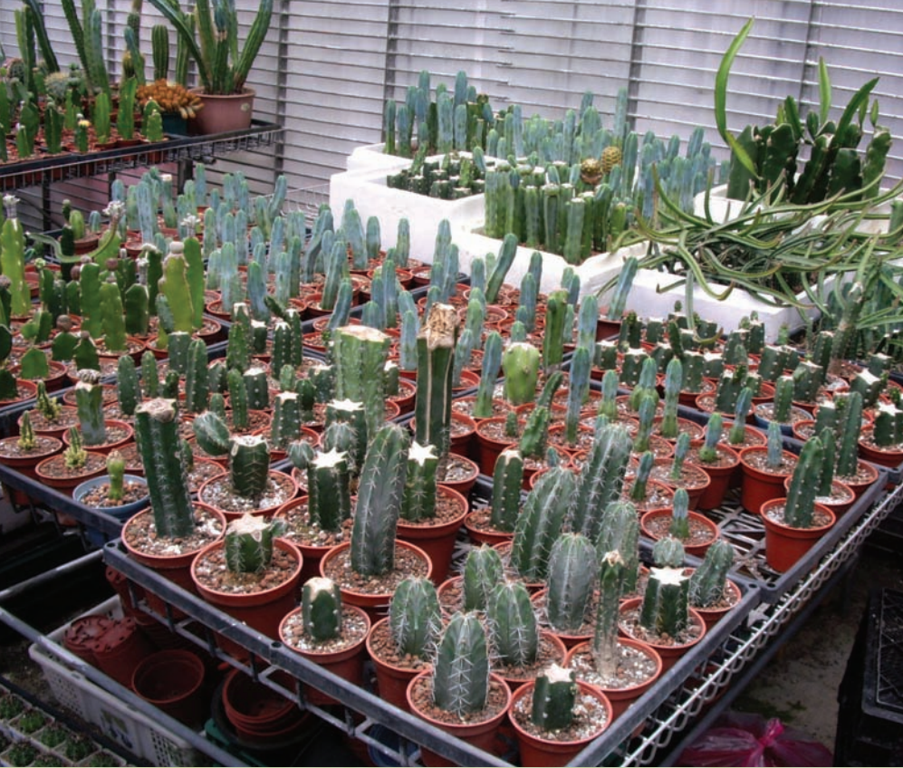
這些較粗壯的仙人掌都將充做台木，成為培育小仙人掌的溫床

掩的門透出一室綠意。張世民自豪地說，該處空間雖然不大，但重質不重量，前後共培植了200多種仙人掌，除賣出的部分，現今仍有大約150種的多肉植物品種。