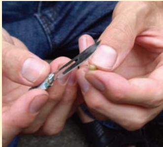
接穗下部三分之一處也切掉