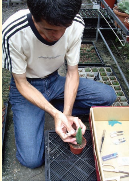
在選好的台木適當高度切出橫切面