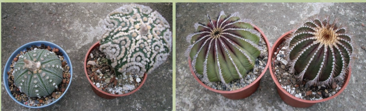
兜（左）與「花園化」後變化的面貌 「皇冠」，是不是真的形如其名