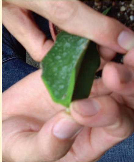
將切好的接穗與台木的切口接合，需特別注意讓兩者的管束部分重疊，這是嫁接能否成功的關鍵