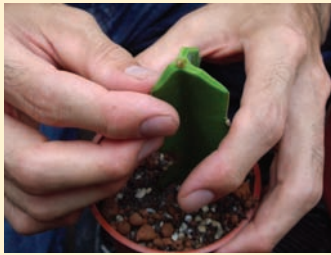
完成嫁接後的植株要放置在通風良好的地方