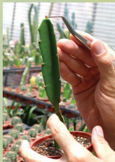
將種子嫁接在木台上