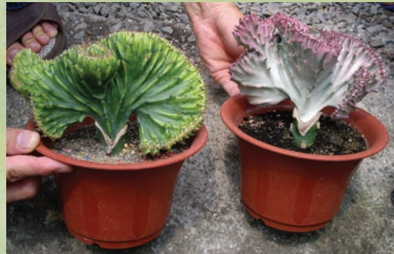
紅的、綠的春峰品種綫化後宛若屏風

十來步範圍的溫室裡，有像蠟柱一般的亞狄麒麟、具鎮定作用的烏羽玉、比籃球還大的金琥、也稱萬年樹的龍舌蘭、五彩繽紛的緋牡丹、會發出臭味吸引蒼蠅授粉的擬蹄玉、狀如成人器官的成人柱及美乳樹等，球型、柱型、團扇型、條狀、棒狀、葉狀，琳琅滿目，種類涵蓋仙人掌科、龍舌蘭科、蘿藦科、百合科、大戟科、景天科、菊科、番杏科、木棉科、葫蘆科，讓人目不暇給。一盆挨著一盆，顯得有些擁擠，卻又各有一處安身立命的所在。