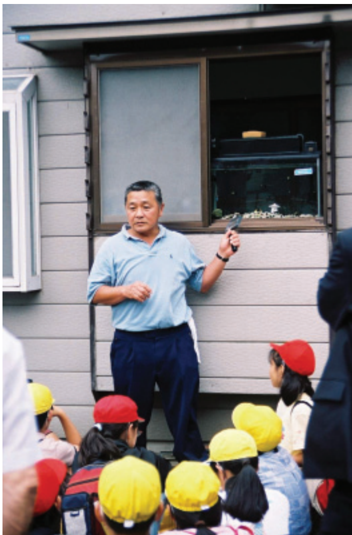
每家後院都可以展示螢火蟲

螢火蟲的出現，成了這個區域無公害、蔬果乾淨熟賣的最佳代言人。該區的村長也以驕傲的口吻告訴我們：「農協的專家剛開始指導我們復育螢火蟲的時候，我們這些不懂現代消費者心理的農夫們，完全看不出來犧牲這麼多生活的方便性，例如：減少汽車排氣、不用現代化學合成的洗衣粉和農藥、肥料等等來復育螢火蟲，對我們有什麼好處？」「萬萬沒想到因為復育螢火蟲成功，吸引了很多遊客，不但帶動了農業旅遊，連我們這一區的蔬菜水果每年都可以增加好幾千萬（日幣）的收入呢！」