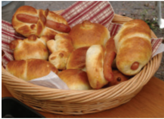
自己做的現烤麵包，令人垂涎三尺！