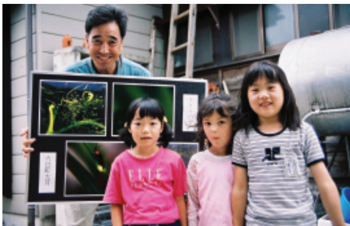
用一小片看板就可述說螢火蟲生命的故事

植的作物：蔬菜、稻米、草莓、香菇、醃菜、水果、柿餅等等，每一家都告訴我們，他們的農產品是多麼地有機、無毒、無農藥等等，最有力的證明就是這裡晚上可以看到很多螢火蟲。