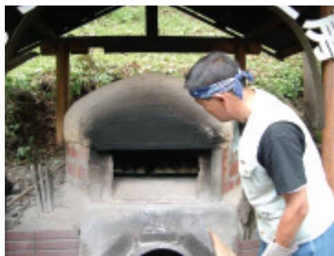
蓋上蓋子，開始烤麵包！