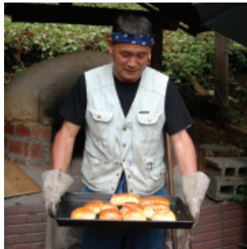
雖然下著小雨，岸榮從準備材料到烤好麵包都撐著傘跟著師傅學習