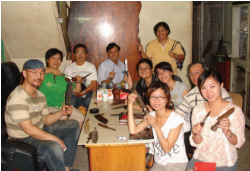
人手一刀，來張大合照吧！

持」林師傅敘述的過程中，眼神透露著堅定，我想他會回來接打鐵店不單僅是興趣使然，還有難以割捨的感情在背後支持著。雖然傳統的打鐵業