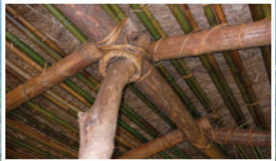
茅草屋頂架構都是採取傳統方式