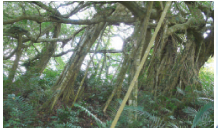
新生氣根由上往下垂著生長