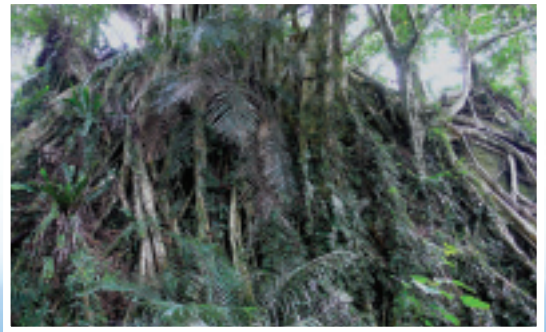
需30多個壯漢張手才能環抱的老榕樹

第一次看到「會走路的樹」，寬廣的一坵白榕樹群，都是由同一株榕樹繁衍連結而來，不禁驚嘆台灣居然還有如此讓人震懾的林相。由樹下往樹冠仰望，有如一大片樹