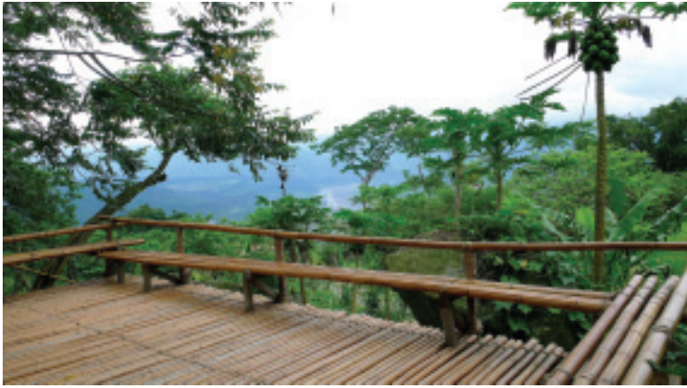
以竹材搭設的觀景台