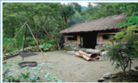
布農族傳統茅草屋