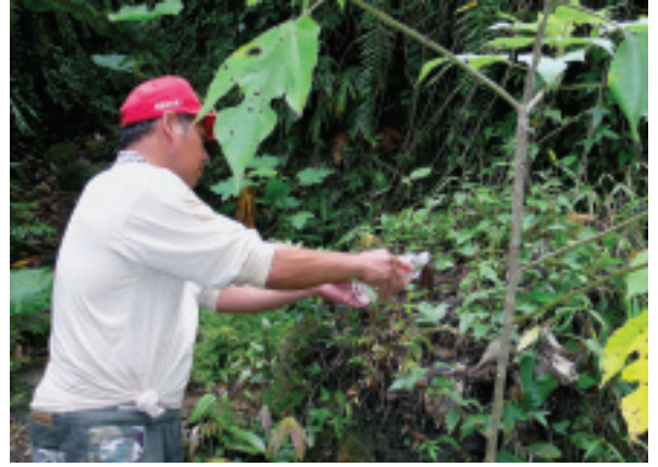
進入獵人步道前敬山神一杯薄酒