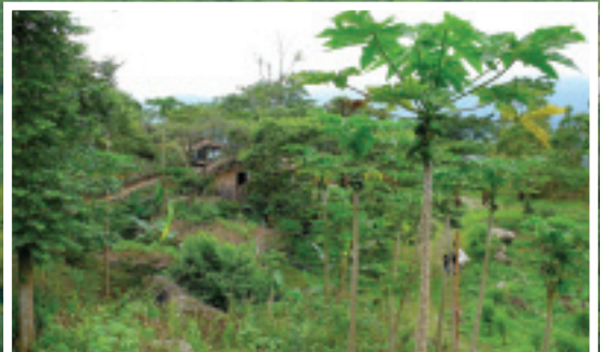
座落於都蘭山麓的森林博物館