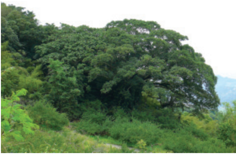
由高處俯瞰「會走路的樹」