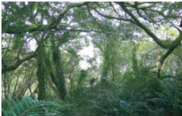
由樹下往樹冠仰望有如一大片樹網