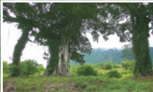
「會走路的樹」之三兄弟