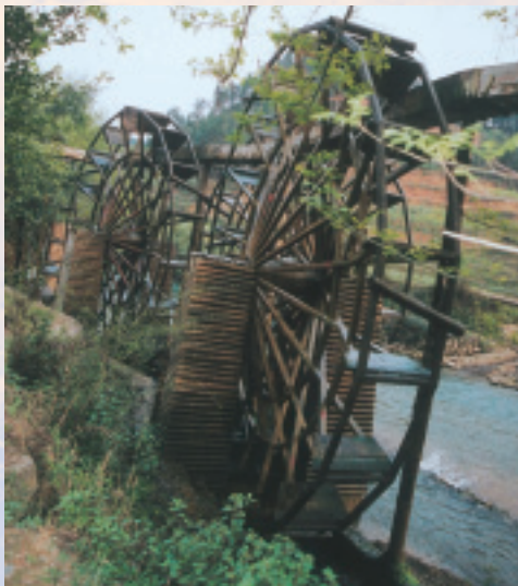
多依河畔的古老水車