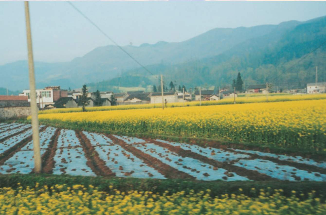
種滿油菜花的布依村寨