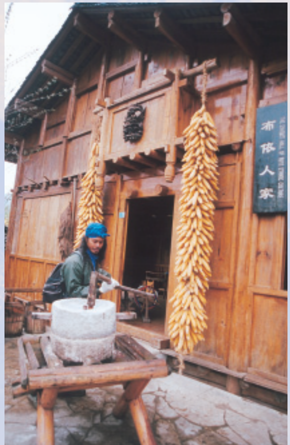
門口總是掛著長串澄黃玉米的布依人家

布依族一年中的節慶不少，除了他們視為新年的潑水節，就以農曆二月二的對歌大會和農曆三月三的花米飯大饗宴最熱鬧了。潑水節的活動都在多依河畔進行，自然沒有缺水之