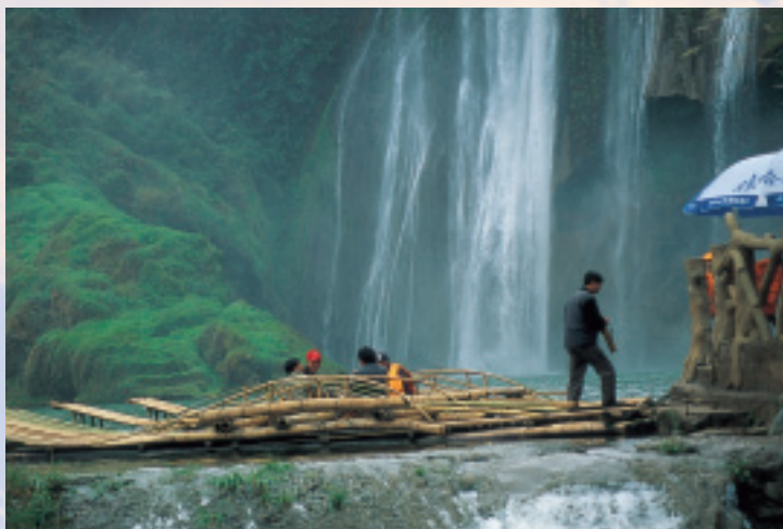
乘竹筏穿越瀑布洗禮一番