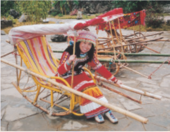
為客人準備的轎子