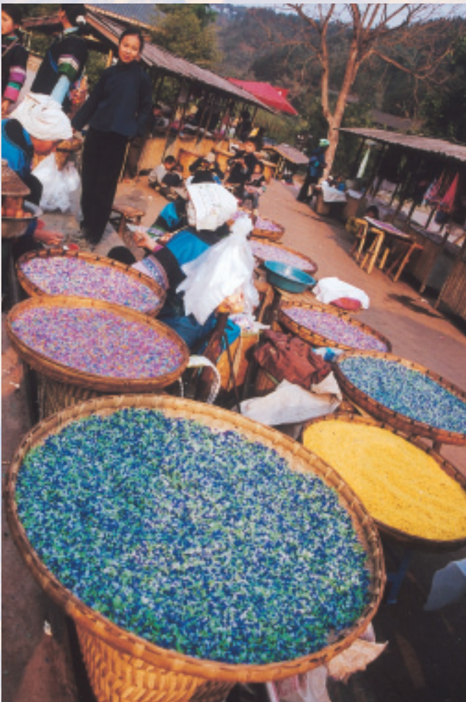
天然植物染成的五色花米，有藥補功效

那天我們來到布依村子口，發現今天好熱鬧，屈指一算正是農曆三月三，難怪有上百布依人家，除了賣彩色米及蒸好的五色花米飯，也賣許多燒烤的小吃，像現烤現炸的河蝦、魚串、臭豆