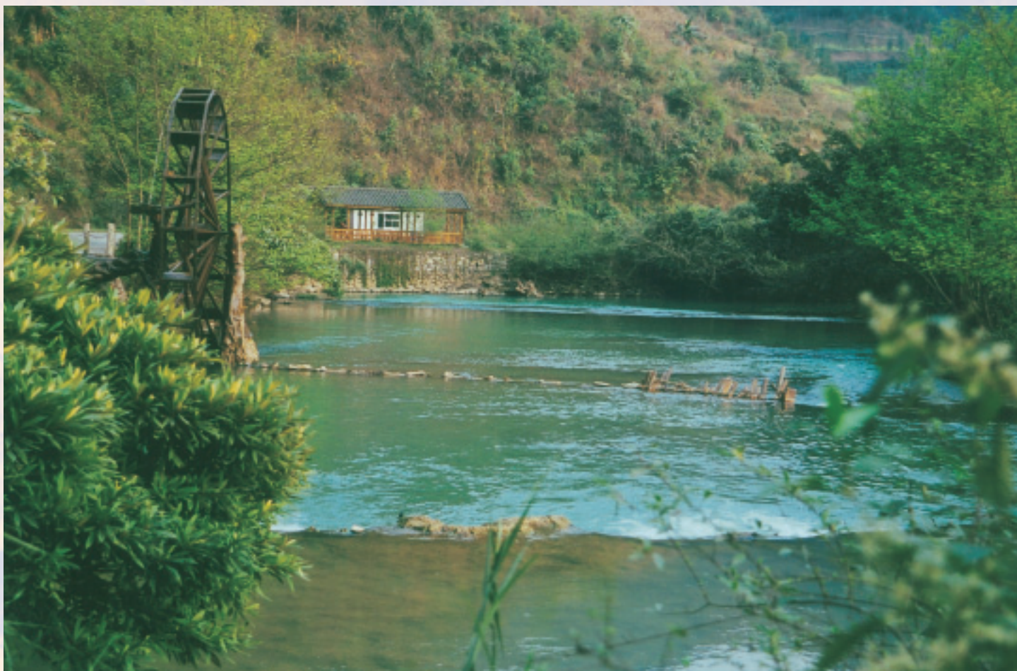
布依族賴以為生的多依河