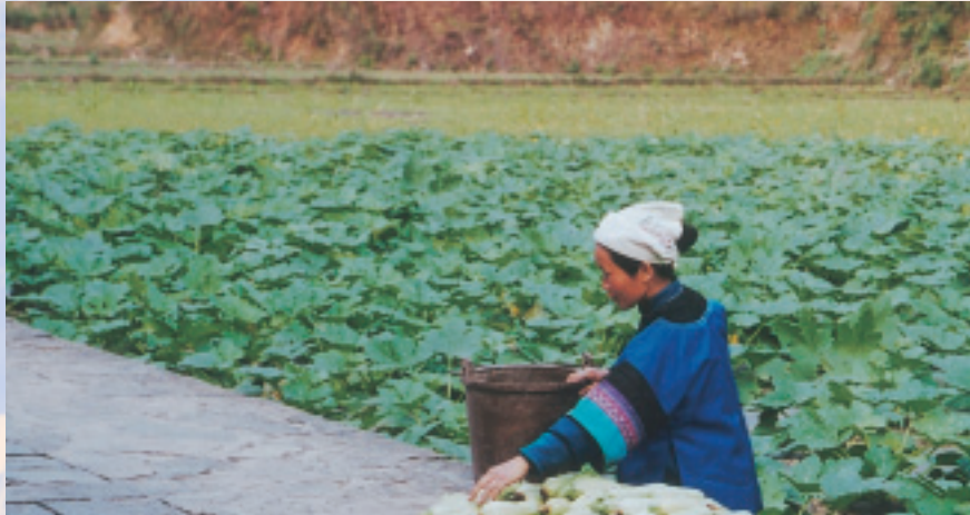
在菜園採瓜的布依婦女