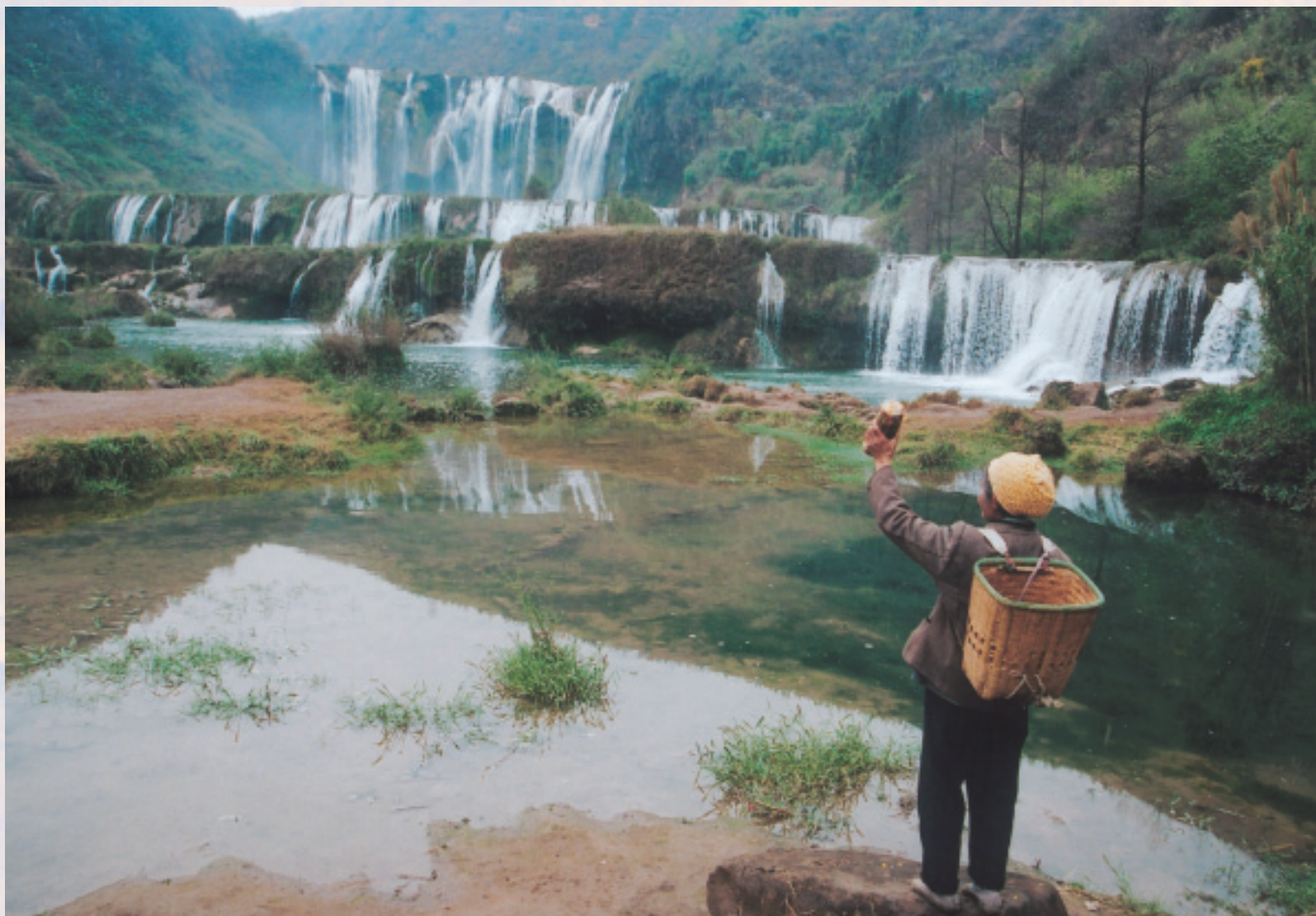
布依人稱它「大疊水」