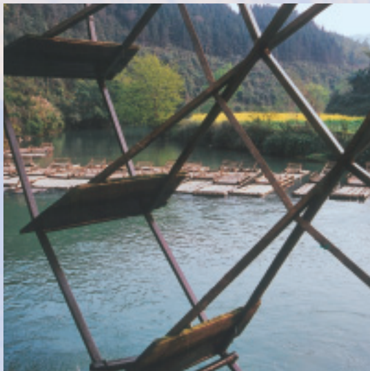
乘竹筏遊河，有節慶時舉辦賽竹筏

液，取出紅、黃、藍、紫等天然色素調入盛有上等糯米的缸中浸泡、洗淨、蒸熟、攪拌、晾乾即可食用。這是布依族傳統飲食中最富有傳奇色彩的一種飲食佳餚，據說已有800多年歷史了，且至今仍保留著原始工藝製作。