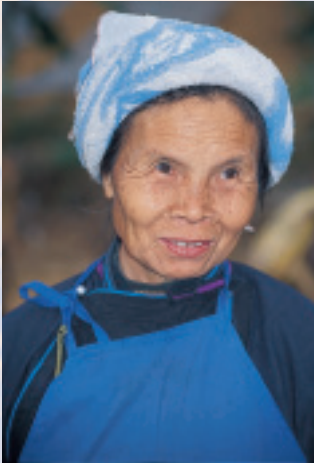
布依婦女以白毛巾裹頭