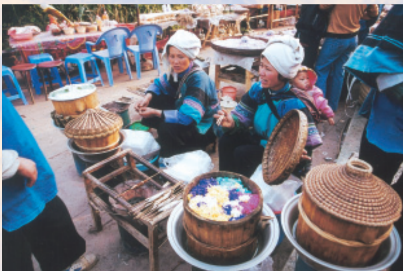
剛蒸好的五色米飯