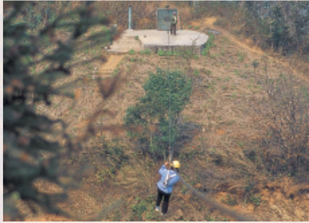
布依人利用溜索滑到對岸