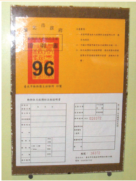
認養動物時需進行狂犬病預防注射，並發給證書