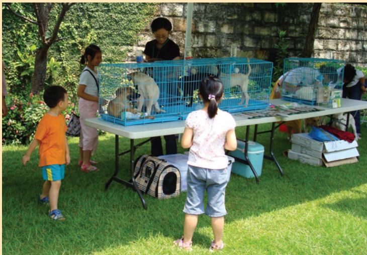
認養動物活動常能吸引許多家庭前來尋找與家人最「合拍」的另類家人