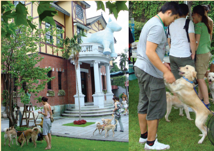
「流浪動物花園」的義工們把家中「寶貝」帶到會場，一邊與有意認養者來場相見歡，一邊與老朋友們敘舊