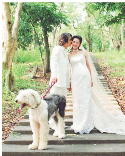
這些「同伴動物」都成了家庭裡的重要成員

「再見了，可魯！」、「極地長征」、「我不笨，所以我有話要說」、「加菲貓」、「阿鸚愛說笑」…，以動物為主角的電影多到不可勝數，每部動物影片上映後，除了賺人熱淚，也掀起一波波的寵物熱，於是大麥町、哈士奇、拉布拉多犬、迷你豬等輪番走入人類家庭，但新鮮感過後，能有多少幸運兒不必淪為街頭翻垃圾討生活的流浪動物？為避免街頭悲歌一再重演，對於自己有沒有能力養寵物？飼養寵物又得注意哪些事？在迎接家中新成員到來前，可得好好問問自己。