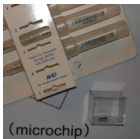
植入寵物身上的晶片只有一顆米粒般大小（右下角），晶片的「壽命」是20年。