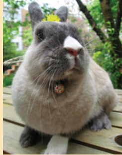
小豬和兔子也常成為人們的同伴動物