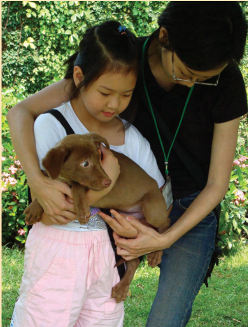
義工細心教導女孩如何對狗狗表達關懷親膩的感情，化解流浪狗的恐懼