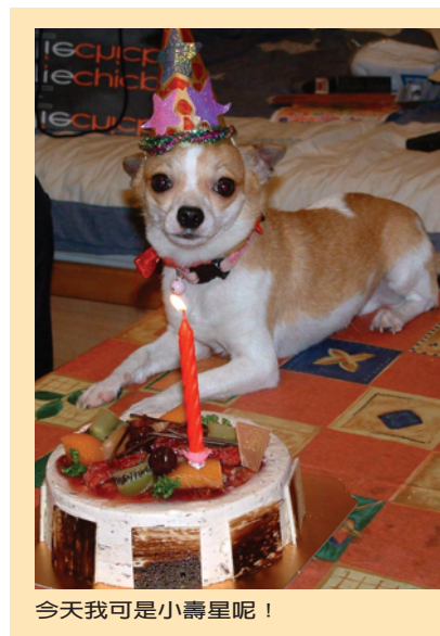
今天我可是小壽星呢！