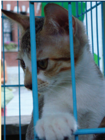
「請帶我回家」，小貓咪膽怯的瑟縮在籠子一角，等候一個愛牠的主人

等指令外，也包含飲食、上廁所、散步習慣及與人相處的方式等，主人必須以耐心及親密撫觸教導，不能急躁。如果能從小開始，效果更好，而且全家人需執行相同的命令，寵物才不會無所適從，透過良好的訓練，也可形成雙方和諧的相處模式。