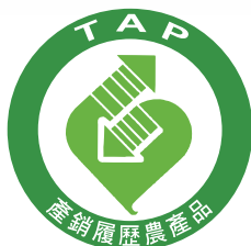
產銷履歷產品 開始啟用