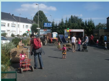
供小朋友嬉戲的大廣場