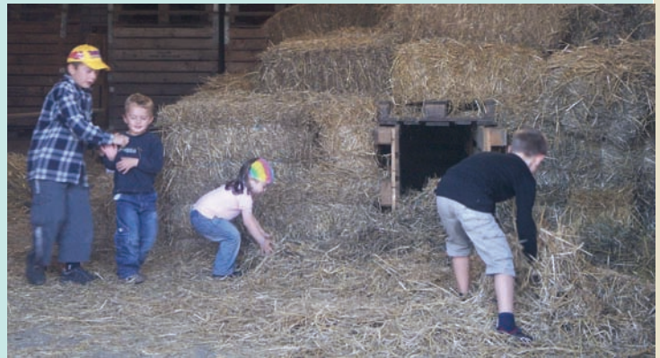
牧草堆與隧道迷宮