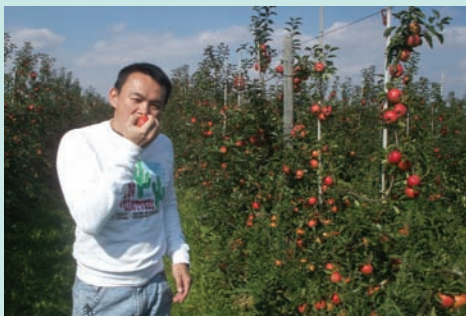
現摘現吃的蘋果最新鮮