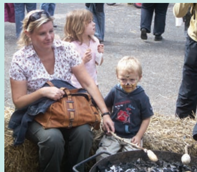
寓教於樂的烤麵包DIY