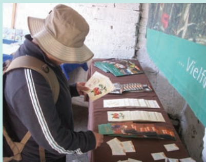
活動宣傳資料與酷卡