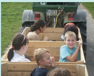
農用車改裝的蘋果專車