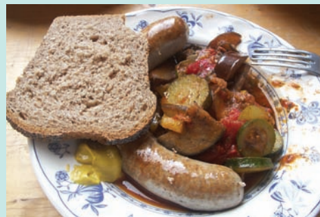
經典德國鄉村美食：香腸、香草燉茄子、麵包

的，不管是大人小孩，輕輕一扭就可以徒手摘下蘋果，而且蘋果園內有很多品種，酸的甜的，任你挑選！現採蘋果每公斤一律 1.99 歐元，十分划算。