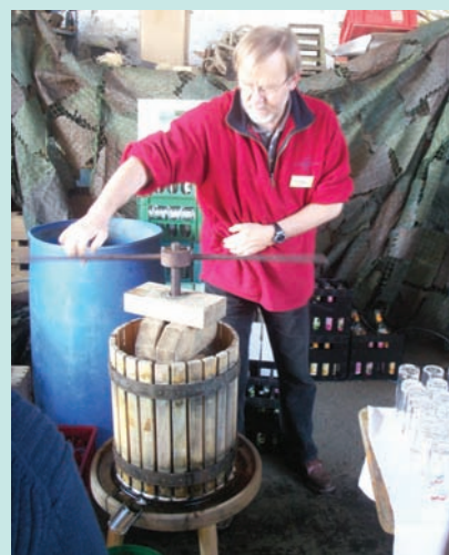
現場示範：現榨蘋果汁

目前我國正在推行「一鄉一特產、一鄉一特色」的觀光休閒產業，這次筆者在德國所參加的活動，不只是一個市集，透過優秀的活動設計與執行，它展現了鄉村的生活與特色，很值得國人參考。