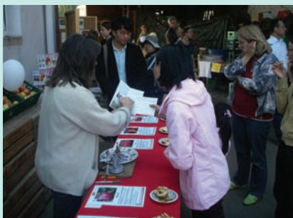
各種蘋果歡迎試吃

到了蘋果園，蘋果樹比想像小了許多，神奇的是長滿了蘋果，小小的蘋果樹能有這樣的產量，真是不可思議，每顆蘋果都是紅通通