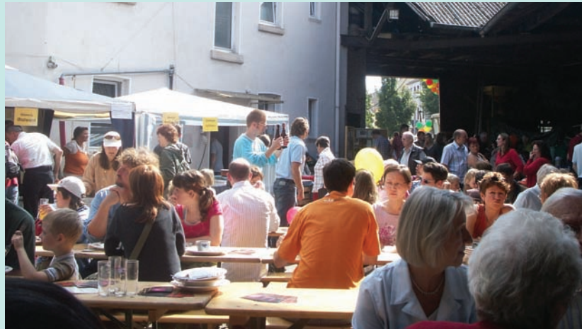
幸福午餐：陽光、歡樂、美食

右邊場地有一棟主要建築，是一家有機農產超市(Obstplantagen Krämer)，超市旁邊有一個