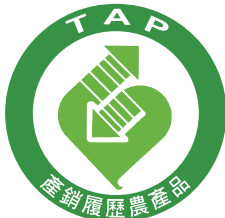
產銷履歷產品 開始啟用