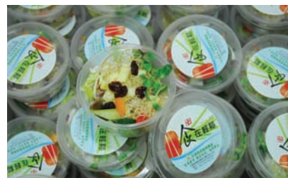
壽豐農會物流中心生菜截切宅配