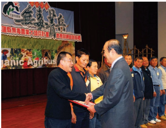
無毒農業授證成為首批認證的生產戶

「假如這是天命，無可退縮，對的事，只有一路往前衝。」 秉持這股信念，花蓮縣政府推動無毒農業4年， 生產健康安全食材，農村生態環境復甦，農民價值觀念轉變， 土地倫理的深層文化在生活中重新播種、生根、發芽， 幸福、知足、互信的良善氛圍在花蓮農村滋長蔓延。