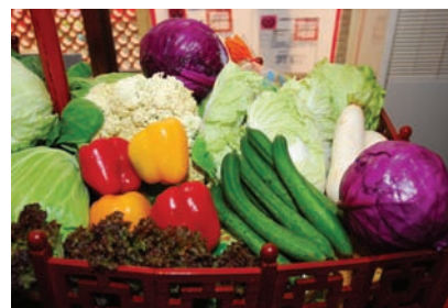
無毒產品也可以這樣美麗