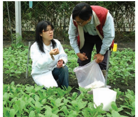
植物醫生指導病蟲害預防工作

首先是養地工作，進行土壤檢測分析，依不同作物施以有機肥；建構生態服務機制，與苗栗區農業改良場天敵飼育中心合作，飼養草蛉技術移轉，目前有木瓜、茶及各種蔬果計70公頃田區，常見草蛉軍團追逐蚜蟲等植食性昆蟲。另外聘請台灣大學技術團隊專案輔導，施以各種有機資材防治病蟲害，讓生產環境與自然相結合，爲未來的休閒農業奠定田間多元體驗的基礎。