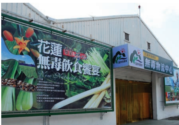
無毒物流中心產品送到府

為塑造、包裝無毒農產形象，縣政府特設計製作代表無毒農業Logo並做商標之註冊。同