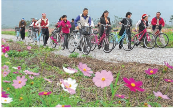
無毒農業營造幸福天地