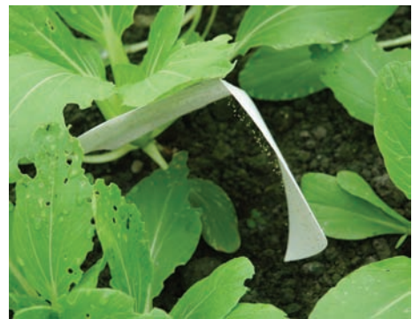
小小草蛉建構生態服務機制