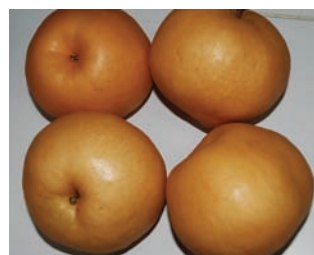
高海拔梨山地區生產的雪梨