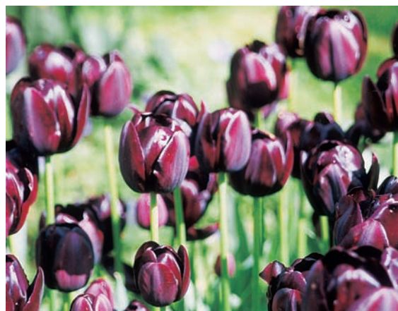
黑色鬱金香是深紫色