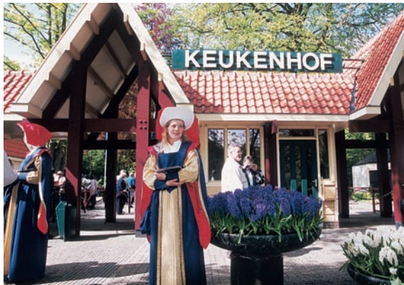
世界最大的庫肯霍夫花園