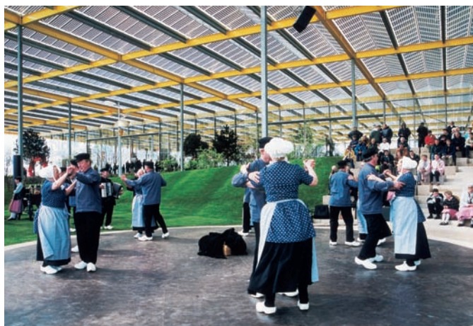
花展會場有傳統舞蹈表演

為了搭蒸氣火車，頭天晚上我們特別住到靠西海岸的Noord小鎮。它是一個寧靜的小鄉村，而這一路我們住的是同一系列連鎖的Golden Tulips（金色鬱金香）飯店。飯店四周不