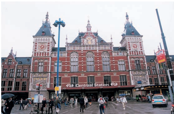
阿姆斯特丹的中央火車站

鬱金香也和我國國花梅花一樣是越冷越開花，但世界上恐怕沒有一塊土地能像荷蘭一樣，將春天的色彩在大地上展現得如此淋漓盡致了！