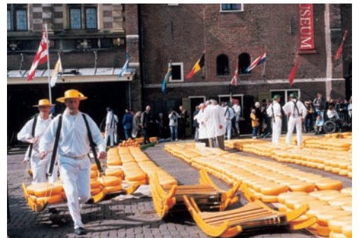
高達乳酪交易中心