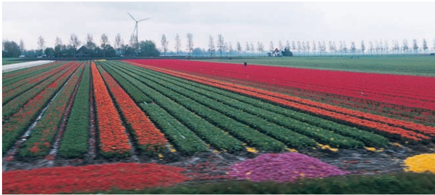
搭乘蒸氣火車賞花田