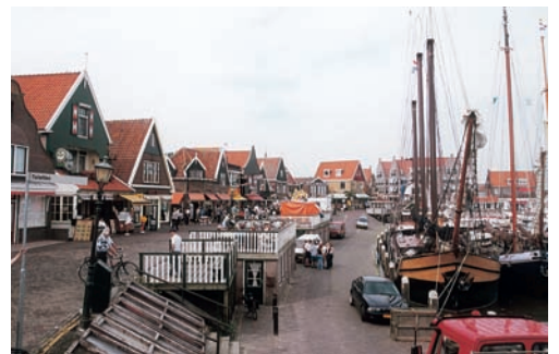
傳統小漁村沃倫丹