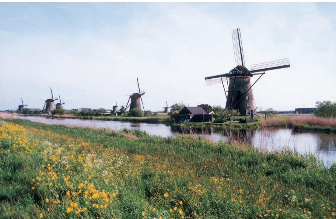
「小孩堤防」的風車群

乳酪和木鞋是荷蘭的兩大特產，木鞋防潮、耐寒又耐穿，自是低地國的特殊產物。穿木鞋也有區分，一般尖頭的是漁民穿的，原木的是婚禮中穿的，觀光客則較喜歡買彩