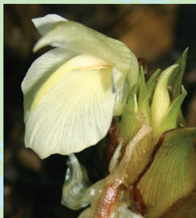
蘘荷粉黃色的小花

這種原產於日本群馬縣、千葉縣，名為「蘘荷」的香辛料作物，俗稱「咪歐嘎」(mioga)，也有人稱為「妙芽」，屬蘘荷科多年生宿根草本植物。從外觀上來看，植株類似生薑，會從