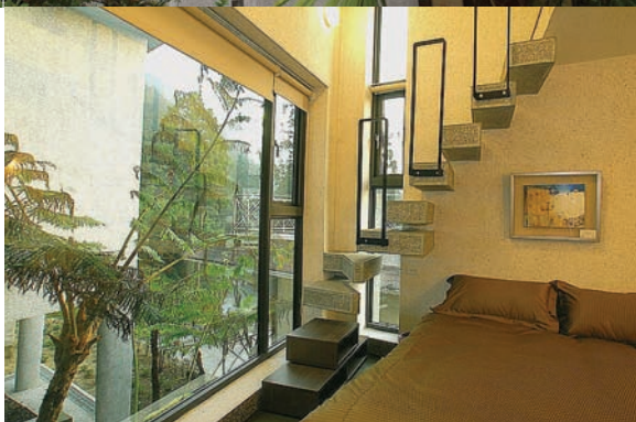
將森林景物延引進「想雲居」屋內