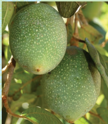
外觀像芒果的愛玉子

猴頭菇是台灣引進栽培的食用菌，因外型酷似猴頭而得名。它原本是一種野生的菌類，現在的猴頭菇，則是採用培養基，將菌絲培養成熟後，接種於太空包，以人工培養而成。新鮮的猴頭菇外貌呈白色，乾燥後變為黃色或淡茶色，除柄部外，均密佈柔軟的針狀或絨毛狀物。