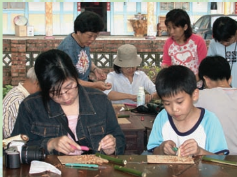
竹笛製作體驗活動