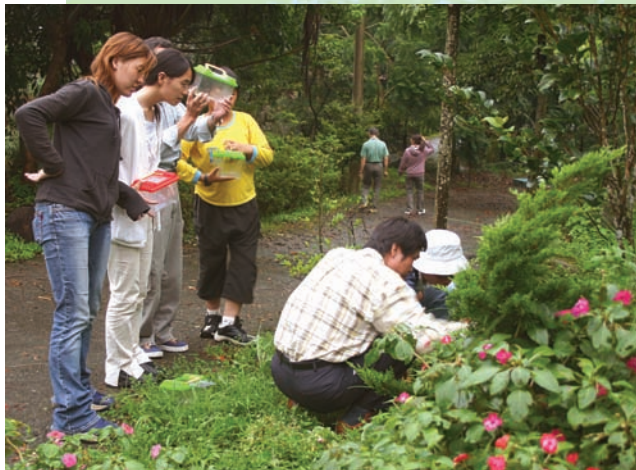
安排蛙類生態導覽解說

夜晚三五好友就著夜光，品茗、喝咖啡、納涼，談天說地，好不愜意。夜間趨光前來的昆蟲，是小朋友的最愛，不論是獨角仙、鍬形蟲、各種蛾類，都是最好的自然生態活教材。抑或熄了燈，仰望滿天星斗，也很浪漫。大熊星座、獵戶星座、織女星座，還有一閃一閃亮晶晶的火金姑飛舞著，數著數著伴隨著蛙鳴，進入甜蜜的夢鄉。