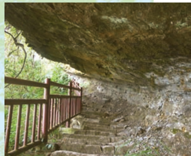
流星崖是大凍山的精華景觀