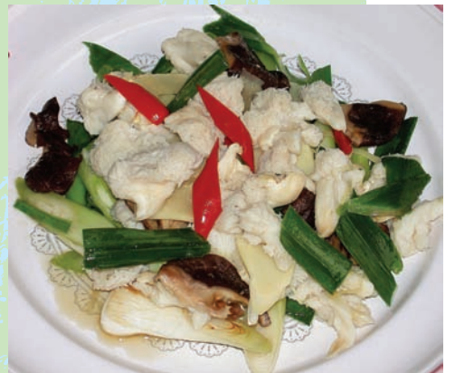
猴頭菇為「中國四大名菜」之一

猴頭菇是台灣引進栽培的食用菌，因外型酷似猴頭而得名。它原本是一種野生的菌類，現在的猴頭菇，則是採用培養基，將菌絲培養成熟後，接種於太空包，以人工培養而成。新鮮的猴頭菇外貌呈白色，乾燥後變為黃色或淡茶色，除柄部外，均密佈柔軟的針狀或絨毛狀物。