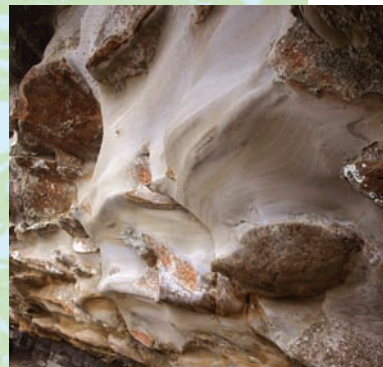
明月窟岩壁經長年風化侵蝕