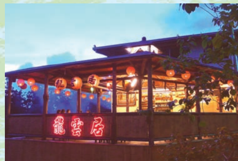
原木打造的咖啡屋

躋身「台灣小百嶽」之一的大凍山，在台灣南部7縣市具有高知名度。因交通便利、登山路徑不難走，且登頂後360度的寬闊視野，讓很多人將它列為「一生中必爬的高山」。行政院農