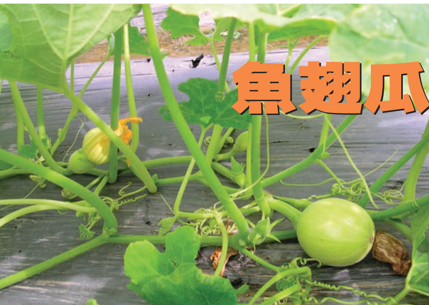
果實發育快（左邊為開花當日的果實，右邊為謝花2日後的果實）