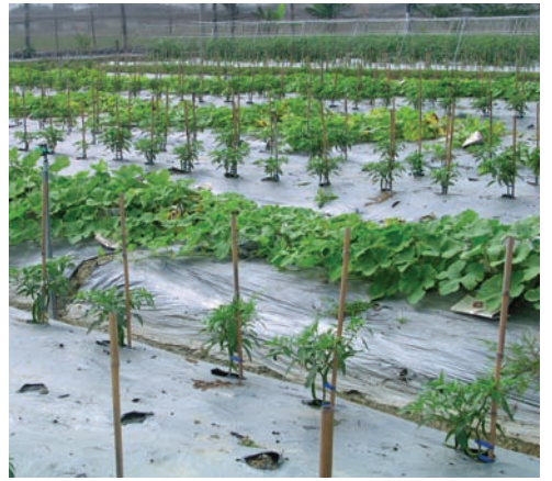
一行番椒一行魚翅瓜，分散蟲害風險

由於害蟲種類原本就少，秋冬季節也不活躍，加上雨水不多，病害孳生機會少，有機栽培相對容易成功。