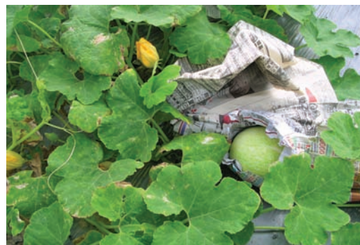
有些果皮的綠斑較淡