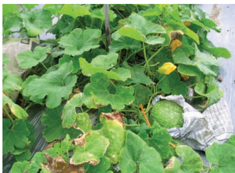
一般人認定的魚翅瓜，外觀很像小西瓜