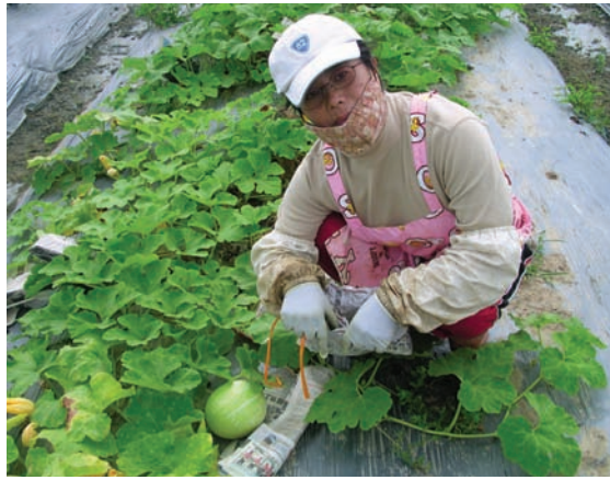
用報紙包裹魚翅瓜幼果，以減少瓜實蠅為害

筆者多年來進行魚翅瓜的品種更新保存，發現在台南地區平地栽培的關鍵點就是「播種期」，一個很基本但是最重要的因素。只要掌握生長期對涼溫的需求，於秋末初冬之際適時播種，有良好日照的環境，魚翅瓜就可以在台南地區的平地栽培。