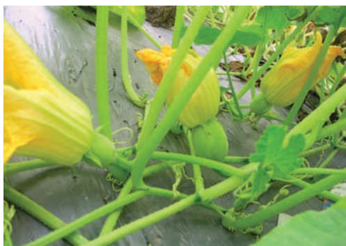
秋冬季於平地栽培的魚翅瓜生長良好，雌花也多

魚翅瓜的生命力旺盛，極易栽培，是有機栽培不錯的選擇。栽培過程上最大的敵人除了「瓜實蠅」以及少數比例會發生病毒外，其他病蟲害不多，就算發生，也很輕微，對植株與果實發育影響不嚴重。