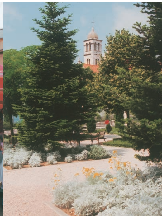
達爾馬提亞北部沿岸旭本尼克之香草公園