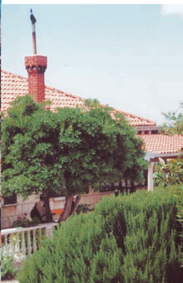
杜布多尼克附近農家庭院，與人同高的迷迭香植株