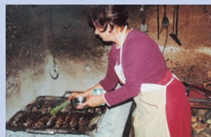
迷迭香沾橄欖油輕拍魚身