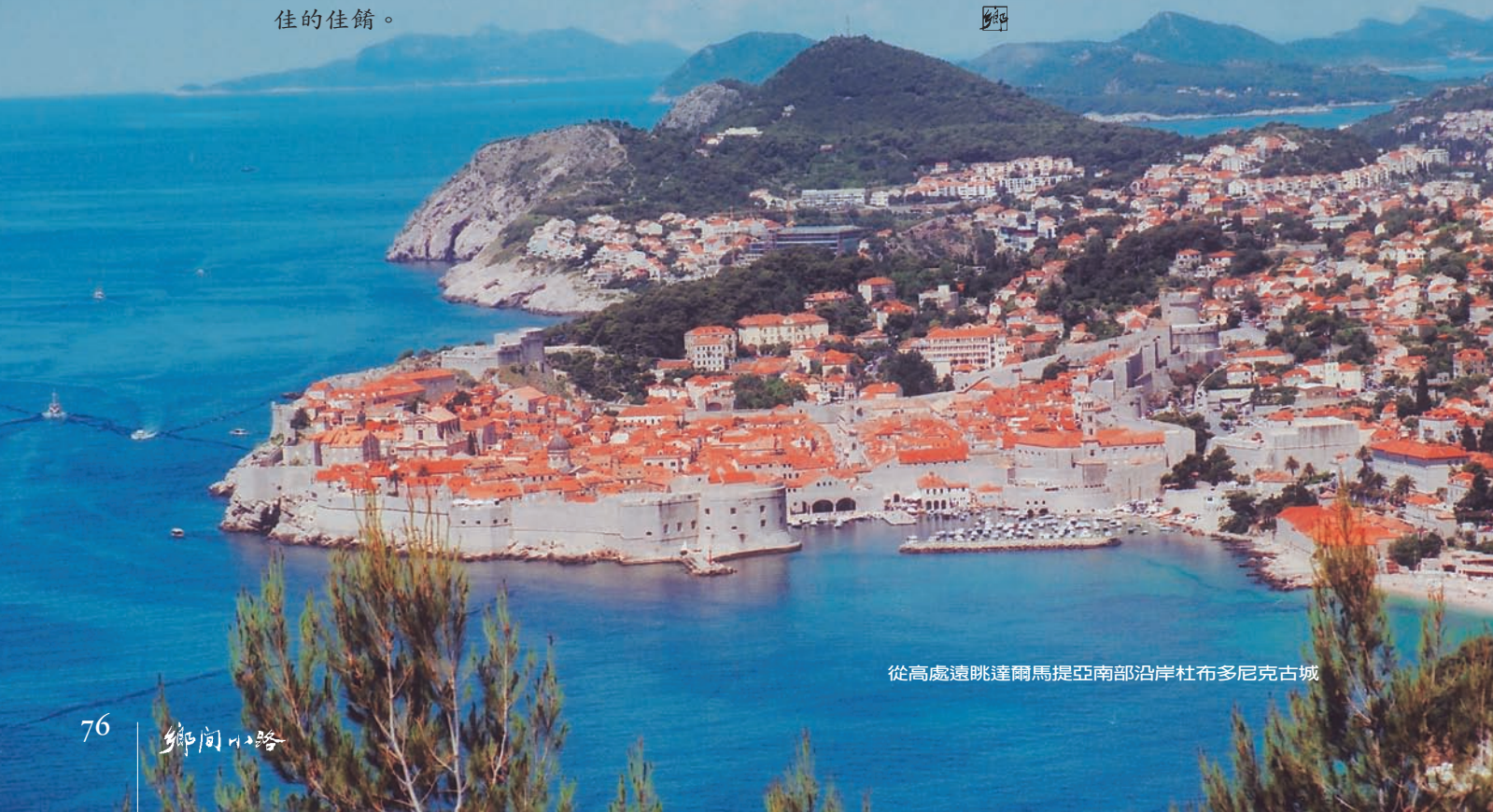
從高處遠眺達爾馬提亞南部沿岸杜布多尼克古城