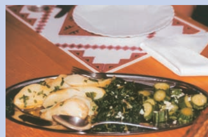
搭配前菜：夏南瓜、野菜與馬鈴薯片