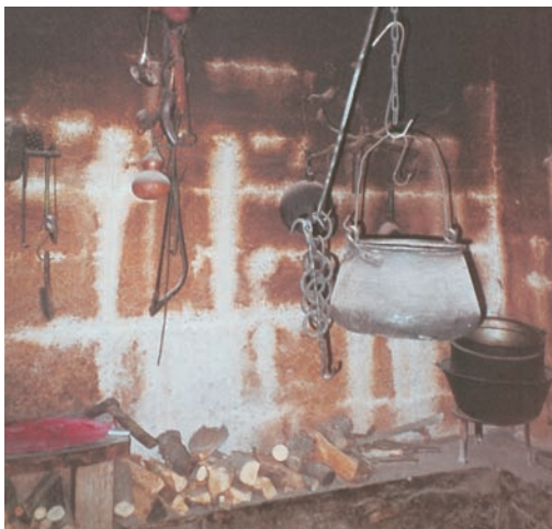
古舊的傳統廚房工具