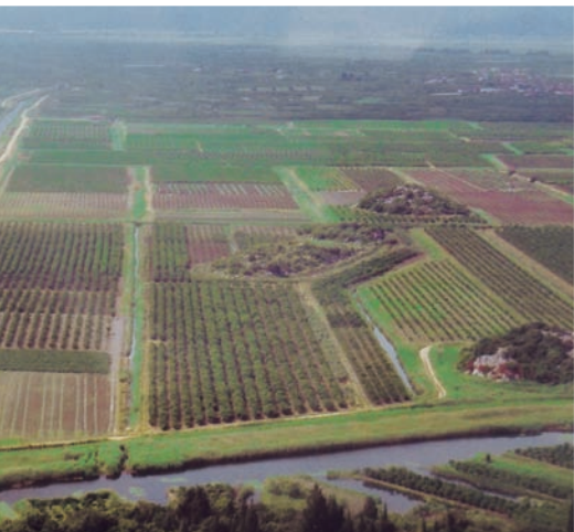
達爾馬提亞中部沿岸之農田景觀