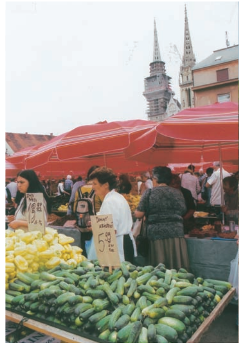
Dolac傳統市集(蔬果攤位販賣的夏南瓜)

在距杜布洛尼克50餘公里的村莊，可品嚐到傳統農家料理——迷迭香烤鱒魚。在傳統的廚房，利用木材將現撈的鱒魚烘烤，隨後以迷迭香枝條沾橄欖油反覆輕拍魚身，裝盤後(以切碎的蒜頭及義大利芹為配料)，再以橄欖油、檸檬調味，即為一道肉質彈性絕佳的佳餚。