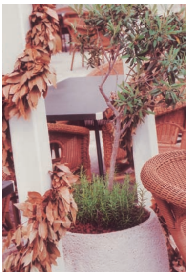
杜布多尼克古城舊港口餐廳，呈串之枯乾葉為月桂，盆栽為橄欖樹及迷迭香