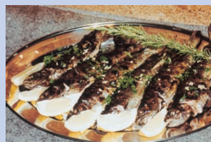
迷迭香烤鱒魚上桌囉