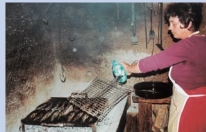
現撈鱒魚鋪於烤架上