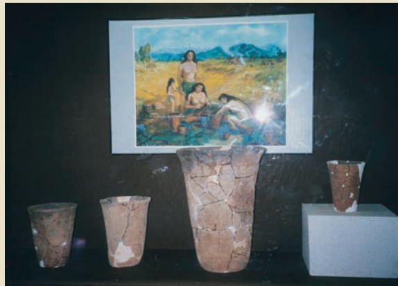
查海人使用之陶器

瑪瑙生產製作，由原來的小型個別家戶，輔導轉型走向產業化、集約化及規模化發展。阜蒙縣寬廣的瑪瑙產業園區，使得瑪瑙產業鍊成形。近年，阜新瑪瑙產業營收，正以平均每年成長三成的速度，快速成長。瑪瑙飾品已列為遼寧省十佳旅遊紀念品之一，如果您識貨，可以在阜新挑選到高貴不貴，但造型及質地精美的瑪瑙飾品。瑪瑙不但促進阜新市可持續的經濟發展，也帶動了旅遊產業。「阜新瑪瑙雕」已被文化部列入國家首批非物質文化遺產推薦