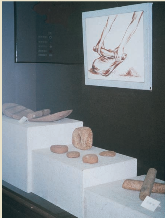
查海人使用之石器

要表現在巧、俏、絕、怪、新等特色，藝術品現已形成七大系列，品項高達200多種。阜新瑪瑙師傅以雅活精神為代表的作品，屢獲國家級寶玉石天工獎。