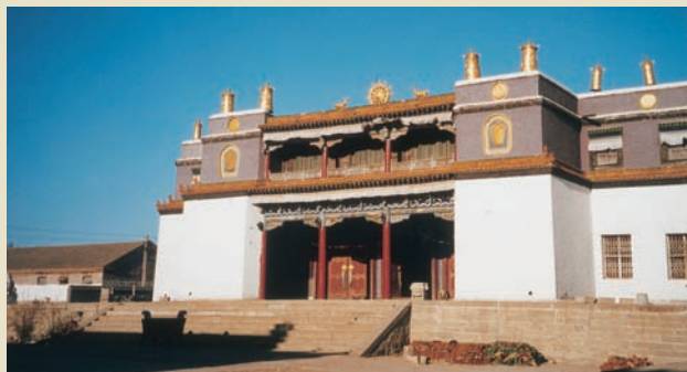
阜新瑞應寺有「東藏」美名

阜新市為中國第一個資源型城市，轉型發展循環農業、造林及瑪瑙等產業，建設有成，吸引無數中外客商。