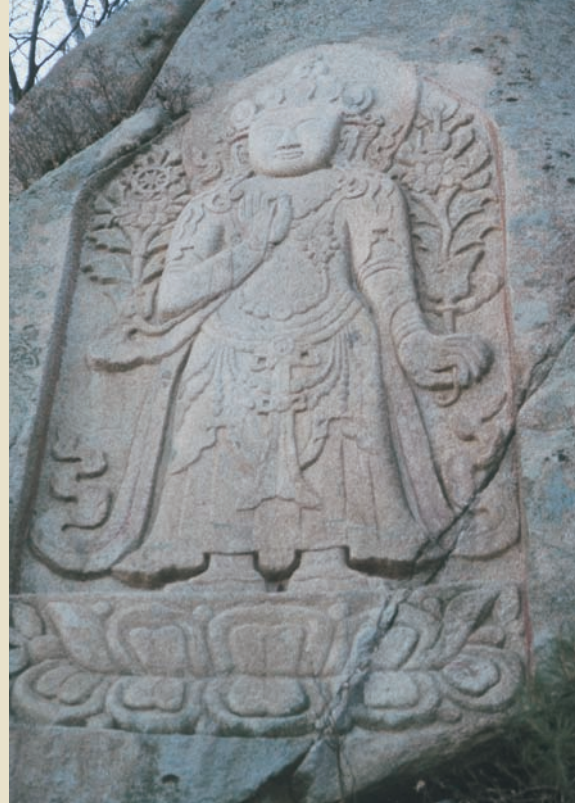
摩崖石刻堪稱中國一絕