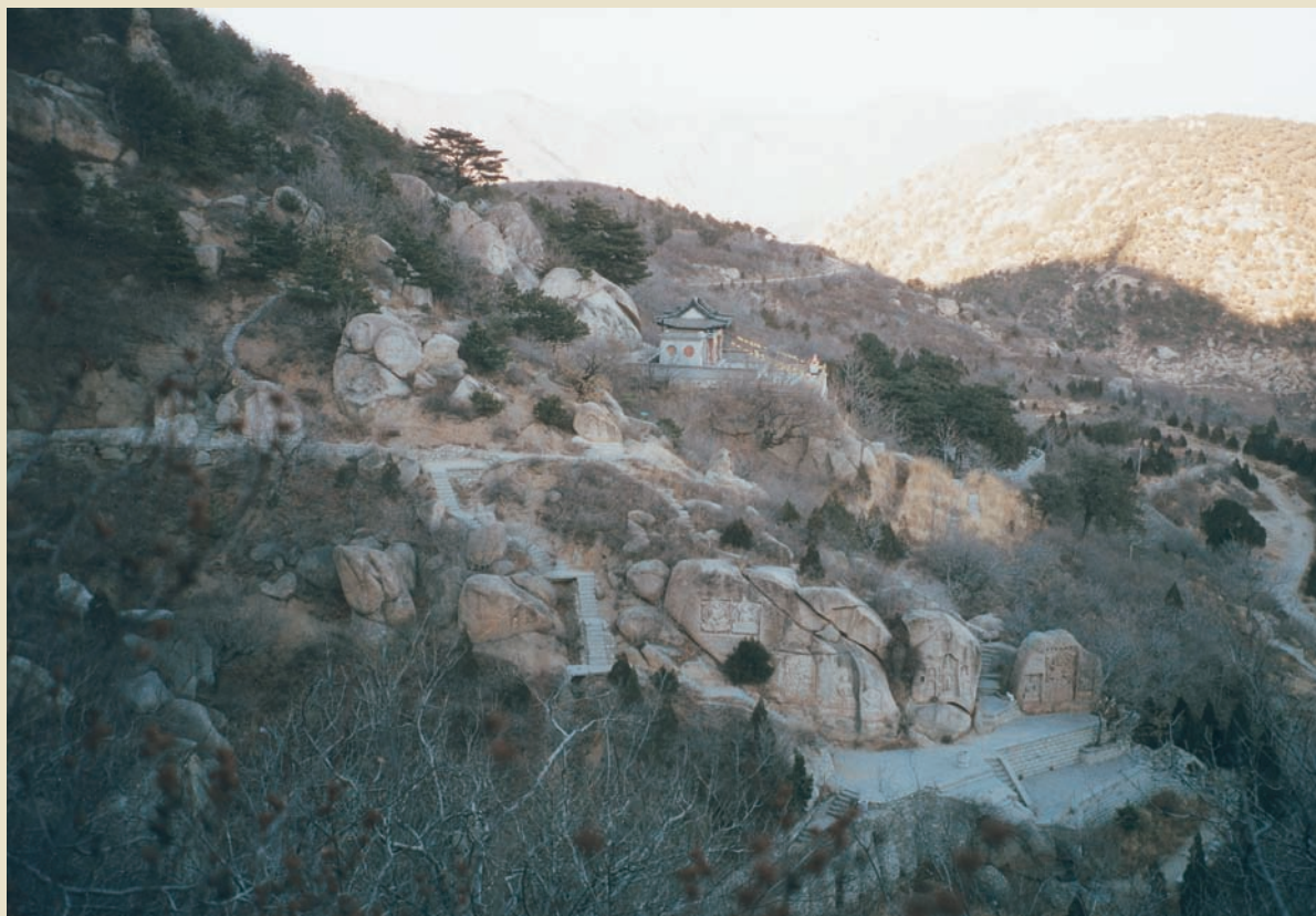
著名的海棠山摩崖石刻