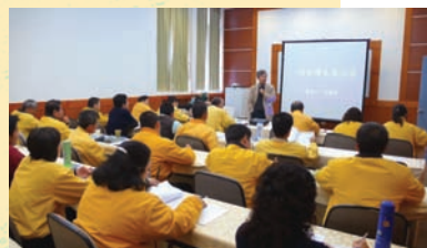
飯店內備有大小型會議室