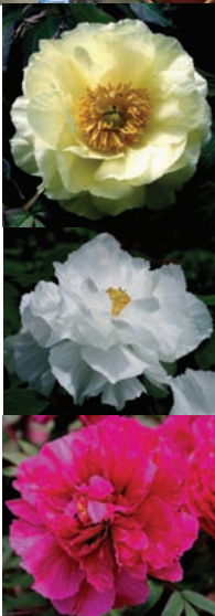
雍容華貴的牡丹花

牡 丹是中國傳統名花，端麗嫵媚，雍容華貴，兼有色、香、韻之美，讓人為之傾倒。在中國歷史上，有不少詩人作詩讚美，如唐詩譽為「佳名喚作百花王」；宋詞《愛蓮說》中，「牡丹，花之富貴者也」名句，一直流傳至今，因而「百花之王」、「富貴花」，便成為讚美牡丹的別號。