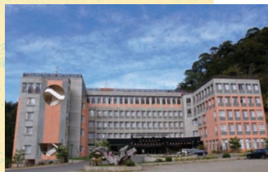
外觀宏偉壯麗的杉林溪大飯店