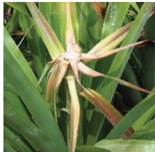
剛採收鳳梨後的植株，莖部會生齒芽出

鳳 梨為熱帶作物，溫帶地區人們要見識鳳梨，並不容易。早期歐洲王室貴族為展示國力與財力，開闢植物園與玻璃溫室，栽種從熱帶地區蒐集而來的奇花異草，鳳梨就是當時熱門的水果栽植，是誇耀富貴與權勢的工具。因此，對歐洲人而言，要觀賞鳳梨，恐怕得到這些地方才看得見，鳳梨也因而帶點神祕色彩，有些人以為鳳梨像蘋果般長在樹上，甚至以為像馬鈴薯一樣，埋在土裡呢！