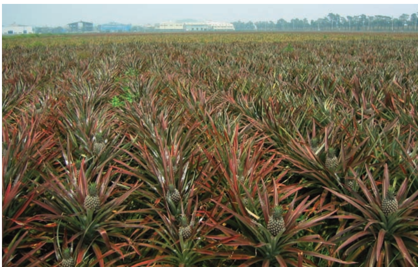
台農6號，又稱「蘋果鳳梨」