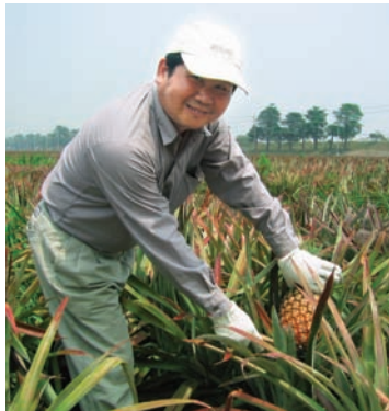
鳳梨採收時，可用刀切除或直接用手拔除

對台灣民衆來說，鳳梨一點也不陌生。原產於熱帶美洲，卻在台灣落地生根、開花結果。不僅味道本土化，還散發強烈的台灣文化特質。大樹鄉是台灣鳳梨產業的發源地，曾經風光一時，也曾經沒落沉寂；技術精湛的老師傅，足跡踏遍台灣中南部，帶動農民投入產業。只為種出好吃的鳳梨，傳承屬於台灣鳳梨特有的那股香味。