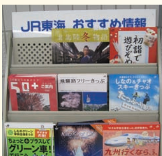
到處都有資訊，方便取用