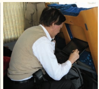
在火車上也可以做功課