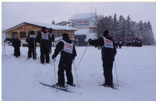
滑雪場上大展身手的健將

秋田新幹線帶我們到達田澤湖，然後抵達乳頭溫泉，那裡有「美人湯」。當時雖是冰天雪地，但單單地名就那麼的迷人，更何況可在那兒舒舒服服的泡美人湯，即使甚至要踏著30公分以上的積雪路