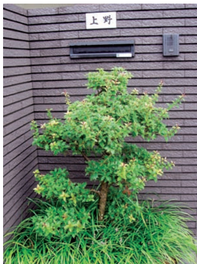
種在玄關前的植物代表這家人的面子

每次帶隊到日本去，團員們大多在鄉村地區的傳統農村遊走。很多人都很感慨台灣現在的旅遊團大部分都只是在一個景點欣賞當地美麗的風景、寺廟、湖泊、高山等等。自由活動時間都是在都