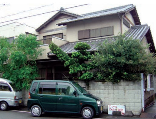
這樣的屋頂和門口尚未造型的樹木，只能算中等人家