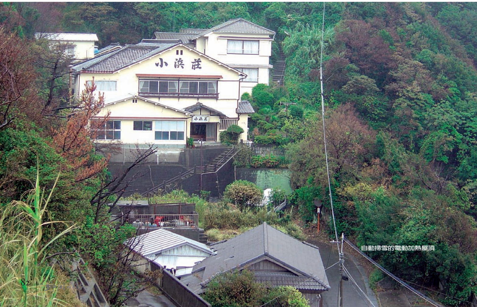
自動掃雪的電動加熱屋頂

這樣說來，日本鄉村早期的農家，好像也是根據這套法則和邏輯在應用。不信你在農村逛一逛，馬上會發現，屋簷往外伸得愈長愈寬的農家，代表的是較富裕的農家。這