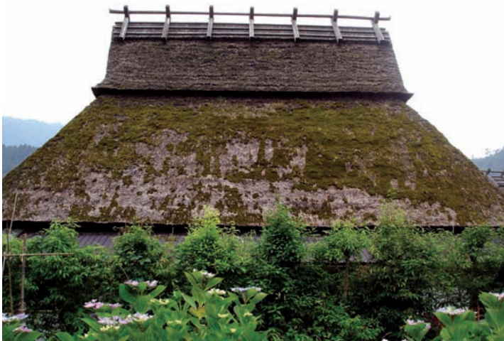
有七根架子的大戶人家，可要多繳稅喔！

第三個判斷是否有錢的特徵，就是日本農家大門進去第一棟建築物—糧倉。古時候沒有冰箱，所有食物都用倉庫儲存。家家戶戶進門都會看見一