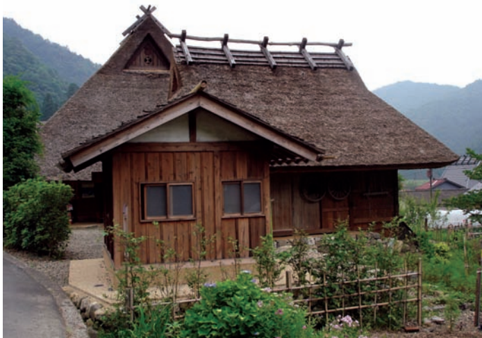
屋頂上的架子數目作為稅收依據，五根是一般人家

以前很窮人家用的茅草房頂，現在卻是有錢人才蓋得起。茅草屋頂可是很珍貴的！冬暖夏涼又有隔音效果，下雨時絕對安靜。每10年要大翻修一次，面向不同風向、雪的方向的斜面，整修的方法也不一樣，而且現在這種老師傅也已經很難找到了，年輕人不