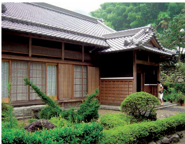
這家的屋頂大概是非常有錢的！

多表示愈有錢，這跟古代歐洲貴族的房子一樣。從建築結構來說，除了主要的樑、柱是承受重量所必須的以外，再用許多粗、厚的木條、木柱來裝飾房屋內外，都是一種炫耀門面的表現手法。就像現代的旅館，遠遠望去就差不多知道是五星級或三星級一樣的道理。