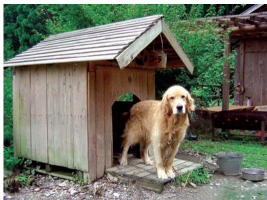
連狗屋頂也有分等級喔！