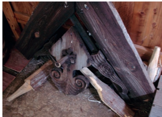
這家掛了二條最普通的懸魚，是鎮災用的

我會告訴團員們：「下雪的地方，就是日本的北方，要知道是有錢人家還是貧困家庭，從遠處看就看出來了。第一看屋頂，家裡有錢沒錢，最大的差別就是在屋頂。日本農村中的屋頂有各種材質，瓦（光是瓦的等級就很多了）、琉璃、瓷磚、茅草、鐵皮、木板等等。在下雪的地方，有錢人家用琉璃做為屋頂的建材，他們請得起工人爬到屋