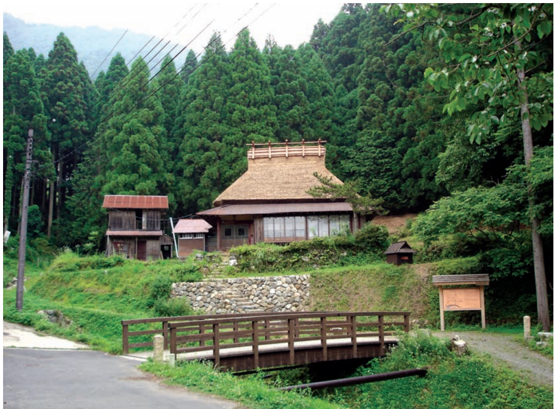
雖然只有五根，前面還有糧倉，大概也過得去吧！

單看屋頂還不夠，還要看看鄉下人家的庭院，庭院裡的松樹修剪得愈圓愈密的，就代表是愈有錢的人家。在寒地下雪的地方要照顧松樹是很困難的，還要一層一層地像修剪髮型般，修得圓圓、密密的。最典型的就是日本皇宮前的那幾棵松樹。修樹的師傅也有大師、副手、助理等階級之分，頂級的師