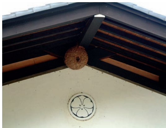
有家徽的豪門巨宅糧