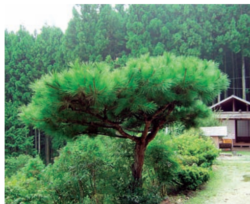
看這家的松樹大概是以前很有錢，現在沒落了

個很大的糧倉，糧倉上面有一個很大的家紋，就像現在的CIS品牌一樣。有錢人家從外表看過去，糧倉大，蓋得又豪華，表示他們家很有錢，可以儲存很多的食物；而窮人家連現吃都不夠，蓋再大的倉庫也用不著。