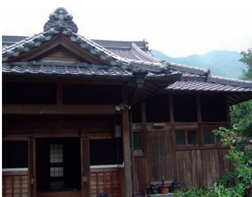
這間古厝顯示祖先留下的豪宅，子孫也有能力修繕成同等級的琉璃瓦