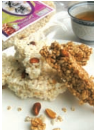
「玉溪競賽米」是玉溪米中的精品 用玉溪米做成的「米花餅」也頗受歡迎