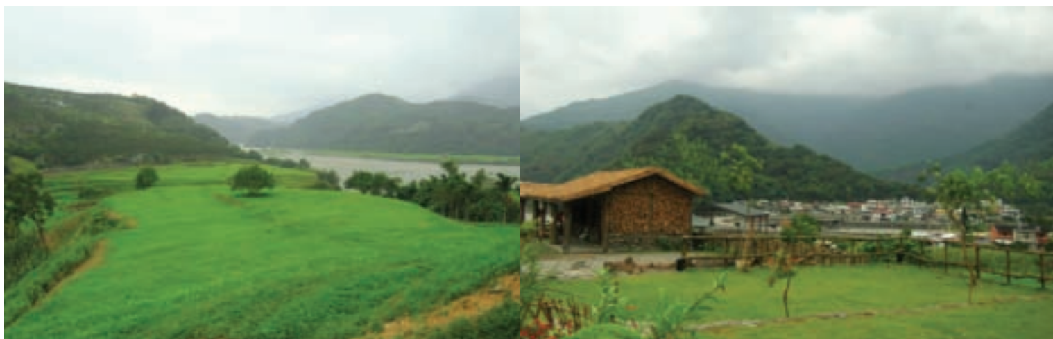
卓溪山區如詩如畫的部落風情