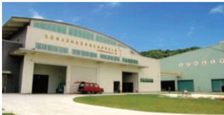
甫落成啓用的玉溪地區農會觀光無塵精米工廠

滋育稻禾，還有豐富的有機物、礦物質和微量元素，賦予「玉溪米」絕佳的特色和風味。光是簡單的清粥，濃稠富含「米油」(註1)的湯汁，就能顯出「玉溪米」