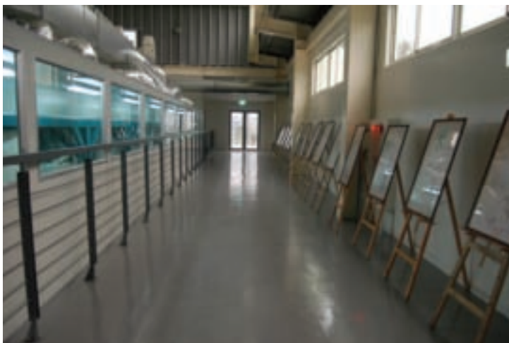
廠區窗明几淨的參觀動線與舒適的展示空間