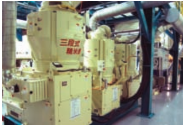
精米設備專屬的機房，不但機具一塵不染，就連地板也光可鑑人

除了先進的精米設備，大幅提高精白米的产品價值之外，「玉溪地區農會觀光無塵精米工廠」也兼具觀光休閒、產業文化傳承、環境保護等教