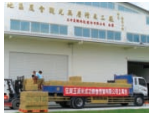
「玉溪地區農會觀光無塵精米工廠」甫開張啓用，就獲得大型便當連鎖業者的青睞

可前往清水溪、太平溪，看看玉溪米的灌溉水龍頭，順道拜訪卓溪鄉境內淳樸的部落風情，以及欣賞沿途壯麗唯美的稻田景觀，完整體驗一級、二級、三級產業的種種過程，如此難得的知性、感性之旅，保證讓您的旅遊行程更加精采。所以，下次來花蓮，可別忘了一定要到精米廠參觀喔！