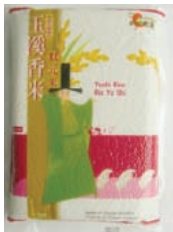
晶瑩剔透，米粒飽滿的「玉溪香米」，煮成的米飯不但香Q可口，還會散發淡雅的芋頭香