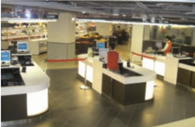
板橋市農會打造媲美百貨超市的購物空間