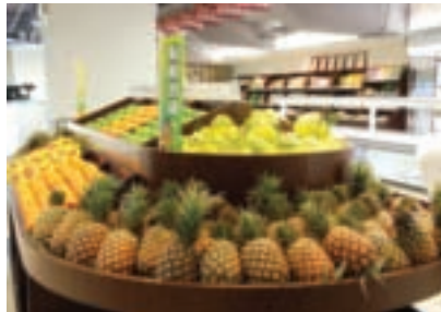
架上的水果賣相佳，健康也有保障

店長不諱言，目前該店的加工食品以國外進口為主，板農積極走訪各地有機農場及農民，尋訪以有機方式栽培的農特產品，如來自宜蘭以高科技低溫風乾法製造的無毒蝦干、南投溪底遙的柳丁醋、取太空包中第一朵香菇的無二菇、花蓮的百草花