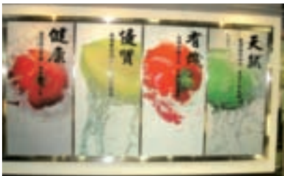
「天然、有機、優質、健康」是板農活力超市的四大核心價值