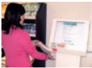
民眾拿架上產品置於端末機讀取區，螢幕立刻顯現產品相關資訊

賣場並貼心設置3座「端末機」，民眾只要將商品產銷履歷二維條碼置於端末機左下方的紅光讀取區，螢幕立刻顯現生產農友姓名、產地、包裝日期、經營業者及驗證機構等資訊，從農場到餐桌，過程全部透明，讓消費者買得放心、吃得安心。