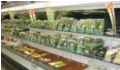
架上的青菜清一色都有產銷履歷「掛保證」