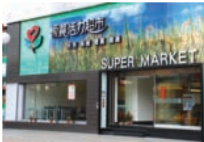
板橋市農會耗資3000萬重新裝潢舊農會超市，打造成具有時尚感的超市

台北捷運板南線府中站1號出口旁，「板農活力超市」鮮活的招牌吸引過往的人潮，明亮、寬敞的購物空間，絲毫不遜於百貨公司超市，不同的是，數百坪賣場的上萬項商品，全部標榜「天然、有機、優質、健康」，不僅呈現出台灣優質農業的縮影，也搭建起消費者對於台灣農業的信心平台，讓「交易」不只是賺錢的生意，也變成公益的事業。