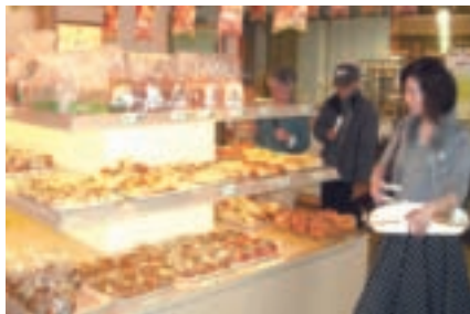
超市一樓的麵包出爐時，總吸引饕客聞香而來

轉型，板農屬都會型農會，欠缺農業生產條件，若單純經營超商，勢必難與量販賣場抗衡，因此農會「創新」