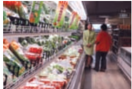
現場有導覽人員為民眾解說、介紹

蜜等，板農並與各地農會合作，如委託南投縣魚池鄉農會生產香菇、提供發芽米給石門鄉農會製成發芽玄米茶，都是極佳的合作範例。