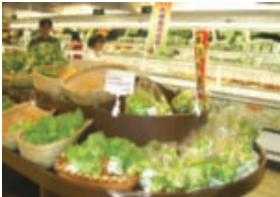
部分尚未取得產銷履歷的有機蔬果，農會仍闢設專區，讓這些有機蔬果上架

店長不諱言，目前該店的加工食品以國外進口為主，板農積極走訪各地有機農場及農民，尋訪以有機方式栽培的農特產品，如來自宜蘭以高科技低溫風乾法製造的無毒蝦干、南投溪底遙的柳丁醋、取太空包中第一朵香菇的無二菇、花蓮的百草花