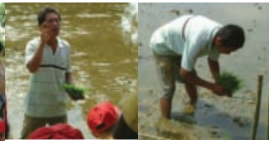
小朋友認真聽、仔細看，了解怎麼插秧