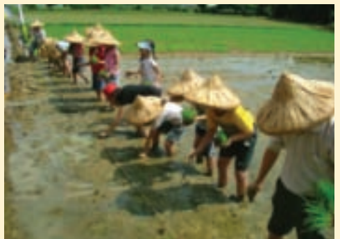
生平第一遭，大家一起下田插秧