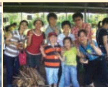
八德市農會舉辦農村巡禮，大小朋友一起控窯