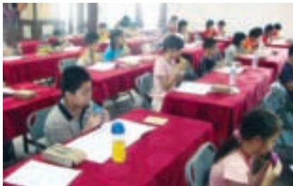
Do~Re~Mi~，在老師指導下，小朋友「全民攻笛」

市農會大樓傳出「小蜜蜂」、「小星星」、「火車快飛」的樂聲，輕快柔滑的曲調，間雜著小朋友快樂的笑聲，雖然樂曲吹奏有時未能一氣呵成，但並不影響大小朋友融入樂聲中的歡愉心情。