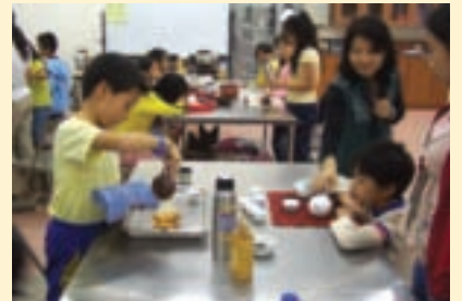
飲茶作業組讓小朋友學習飲茶禮儀