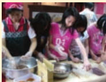
深度米食之旅—學做壽司