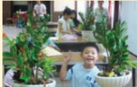
運用多種植物組合的盆栽，每個人都可以發揮創意喔