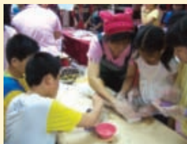
深度米食之旅—學做紅龜粿

學習陶笛得從練習指法開始，接著練習吹奏「Do Re Mi」，許多大小朋友鮮少接觸音樂，剛開始連「Do Re Mi」也吹不出來，甚至感到膽怯，