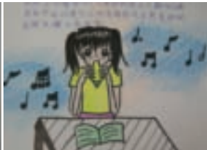
在小朋友的想像中，陶笛既像滑鼠、也像老鼠