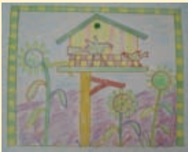
拼布前，先繪製圖樣