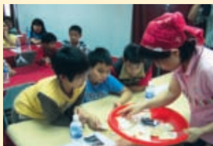
深度米食之旅—先認識各個種類的米