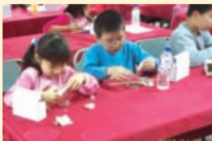
農會開辦果凍蠟燭作業組