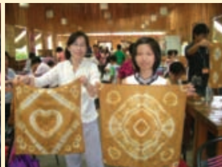
大家一起學染布，男生的針下功夫不輸女生喔

他表示，剛開始，這群在都市裡長大的孩子，有的感到很新奇，也有的害怕毛毛蟲或髒兮兮的爛泥巴，但一下田後，很快地發現，表面看來只是爛泥巴的水田，竟然潛藏著泥鰍等各式各樣的生物，驚奇不已，早就把怕蟲、怕髒的念頭忘得一乾二淨，轉而觀察田間生態，看看水田裡究竟還藏著什麼「寶貝」。