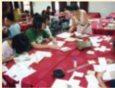
大家聚精會神地學習拼布