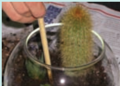
4. 利用報紙包住多刺的仙人掌