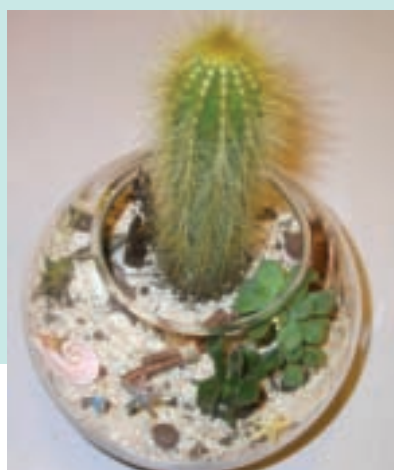
13. 彷彿躺在海邊沙灘上遙望天上的星星