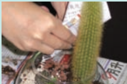
7. 用報紙作成漏斗灑上珊瑚砂