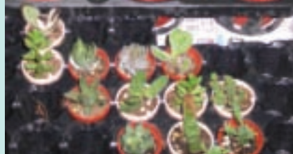
1. 多肉植物形狀多而且大小差距甚大，構圖相當有趣