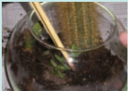
5. 利用免洗筷夾著小小的多肉植物放進玻璃缸內