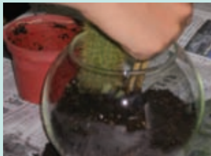
2. 玻璃容器裡放進發泡煉石，一小塊不織布上面鋪培養土