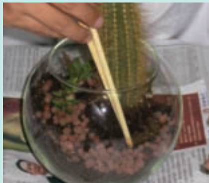
6. 用筷子調整植栽的位置