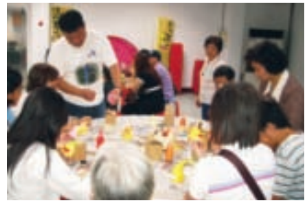
彩繪竹筍實寶也是八里一日遊的豐富內容