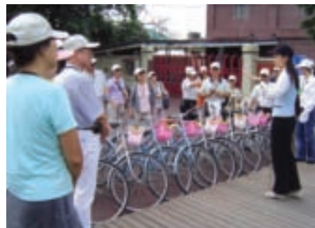
整裝出發！八里自行車之旅就要展開