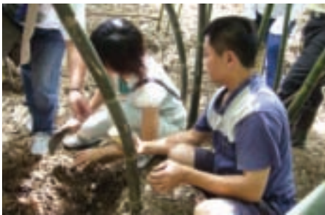
自己挖綠竹筍最新鮮