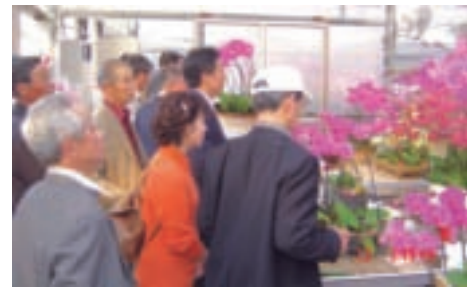
日本旅客參訪八里的花卉種植