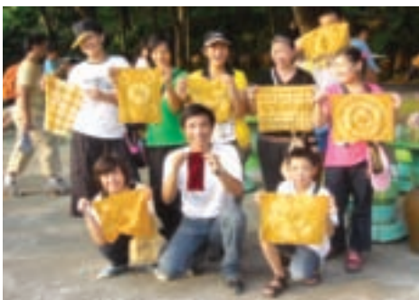
遊客動手染布，很有成就感

大坵坑遺址位於八里鄉埤頭村觀音山、海拔約3、40公尺的緩坡上，以山腰上俗稱大墓公的小祠為遺址中心，是台灣史前新石器