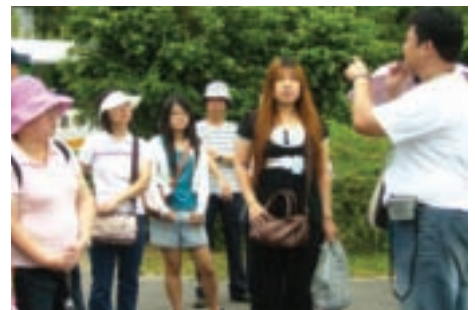
仔細聆聽導覽，才能更瞭解八里