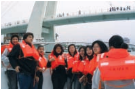
搭船暢遊藍色公路深受年輕人喜愛