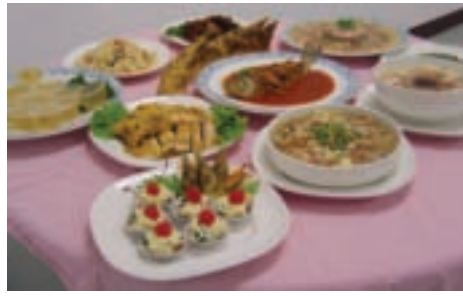
到八里別忘了品嚐道地的田媽媽風味餐