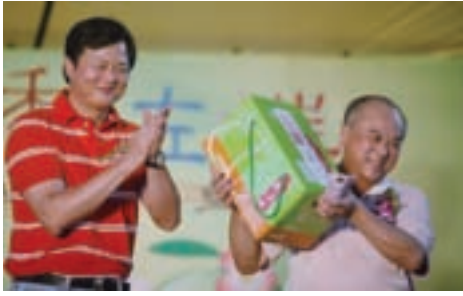
台北縣長周錫璋（左）主持黃金筍拍賣吸引觀光人潮