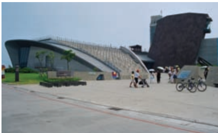
十三行博物館建築物深具特色