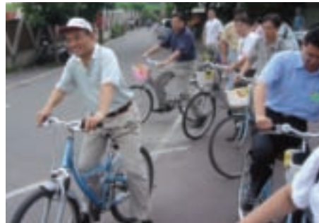
前台北縣長蘇貞昌喜歡到八里騎自行車

你可以租一輛自行車，從左岸公園出發，迎著海風、欣賞河海風光。海風、陽光、浪濤聲，可以追風而行，也可以悠哉慢遊，停下車來在木棧道散步，或是觀鳥或是看林，綠繡眼、夜鷺或白鷺鷥可能就在不遠處；或者，你想到八里渡船頭來一趟古老的渡輪之旅，渡船仍是八里居民到淡水的交通工具之一，在一艘艘渡輪上，彷彿搭上時光機器，穿梭在古老與現代的八里之間。