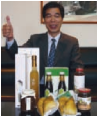
到八里別忘了帶些農會的伴手禮