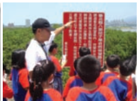
農會人員為小朋友導覽挖仔尾自然生態