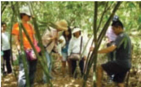
當一日農夫，跟著農民去採筍吧

能遠觀，八里挖仔尾的紅樹林不但看得到也摸得著，讓許多來訪的大小朋友驚豔不已。」不過，農會人員也提醒，一般人探訪挖仔尾紅樹林，看到可愛的招潮蟹都忍不住捉一隻來瞧瞧，但此舉對自然生態影響極大，最好的方式是在旁靜靜觀賞，絕對不要動手捕捉。