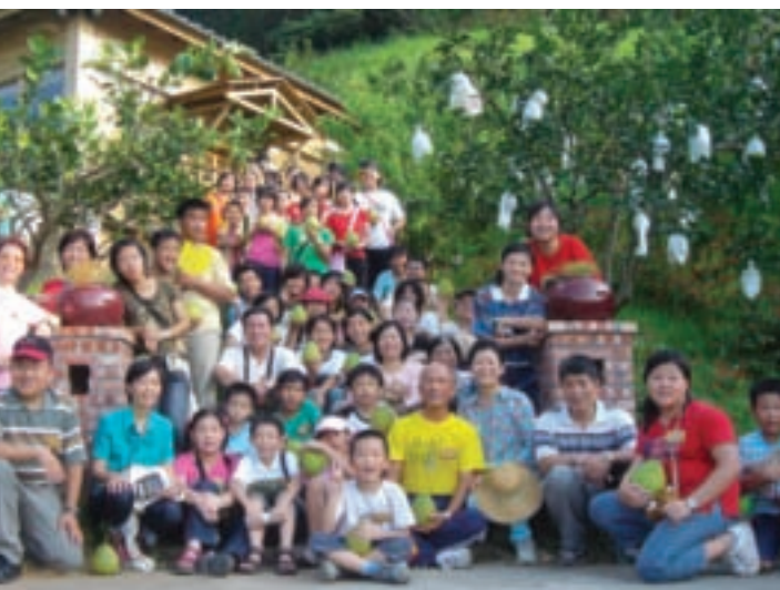
觀光果園採果大豐收