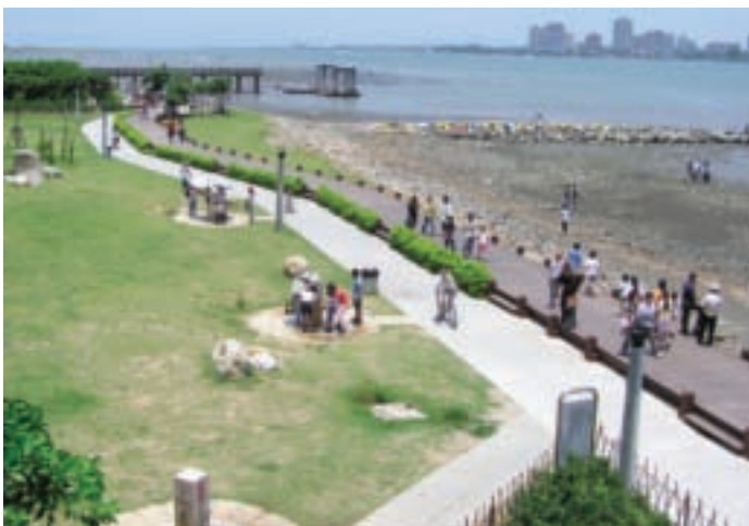
這條左岸風光是蜿蜒淡水河生態文化之旅

以前，八里像隻醜小鴨，只能默默地看著淡水河對岸的淡水鎮發光發亮。八里和淡水，分別位於淡水河的兩岸，兩者的際遇卻大不相同；右岸的淡水，有捷運抵達，加上觀光發展得早，早已是著名的觀光景點，每逢假日，總有大批人潮湧入；反觀左岸的八里，早年缺乏整體的觀光規劃，只是純樸的農村小鎮。