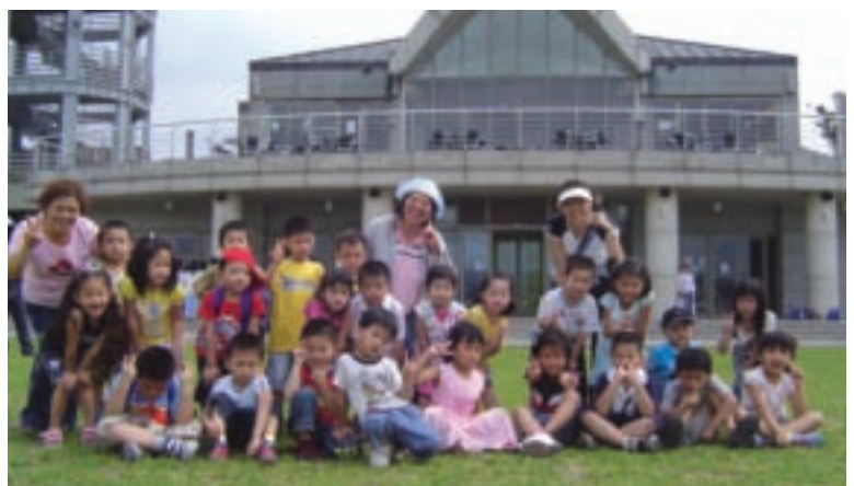
左岸會館是小朋友探訪八里的重要景點