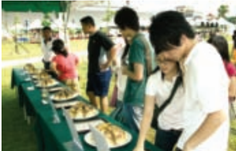
八里特產綠竹筍吸引許多遊客嘗鮮