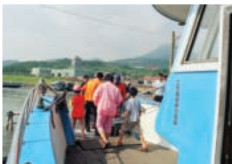
八里渡輪之旅飽覽淡水河左右岸的風光