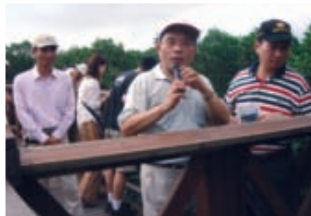
前台北縣長蘇貞昌（圖中）扮演起導覽人員解說八里風光