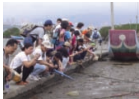
睜大眼睛仔細瞧，招潮蟹正和你招手呢

八里文化走廊的盡頭是北台灣第一座考古博物館——十三行博物館，主要展示十三行遺址出土的