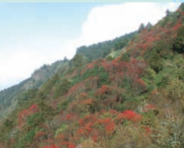
新中橫公路秋冬季節的楓紅景觀