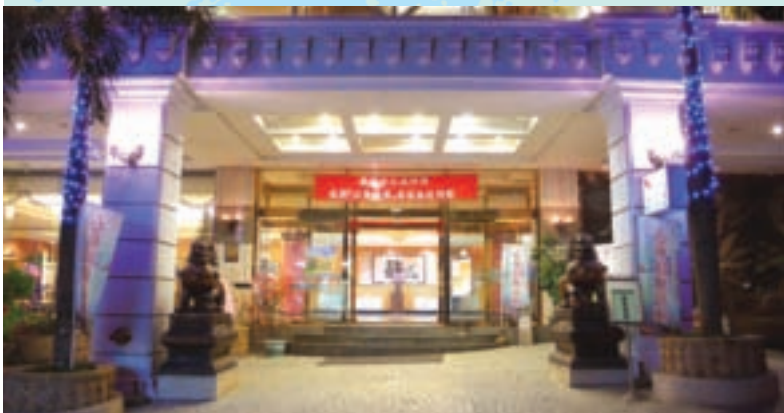
「帝綸」是東埔地區唯一榮獲優良旅館的大飯店

帝綸溫泉大飯店除了首創室內洞窟式溫泉水療館、洞窟式露天SPA溫泉，還結合日本浪越指壓服務，讓人不覺完全放鬆。並提供梅子風味餐、企劃布