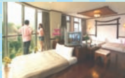
寬敞舒適日式客房

步入原始林步道，來個健康的深呼吸；或至溪泉、瀑布，吸納大自然的陰離子。結合高山溪流景觀、原住民文化、豐富的農特產，以及優質溫泉，南投縣信義鄉值得您深入探訪。