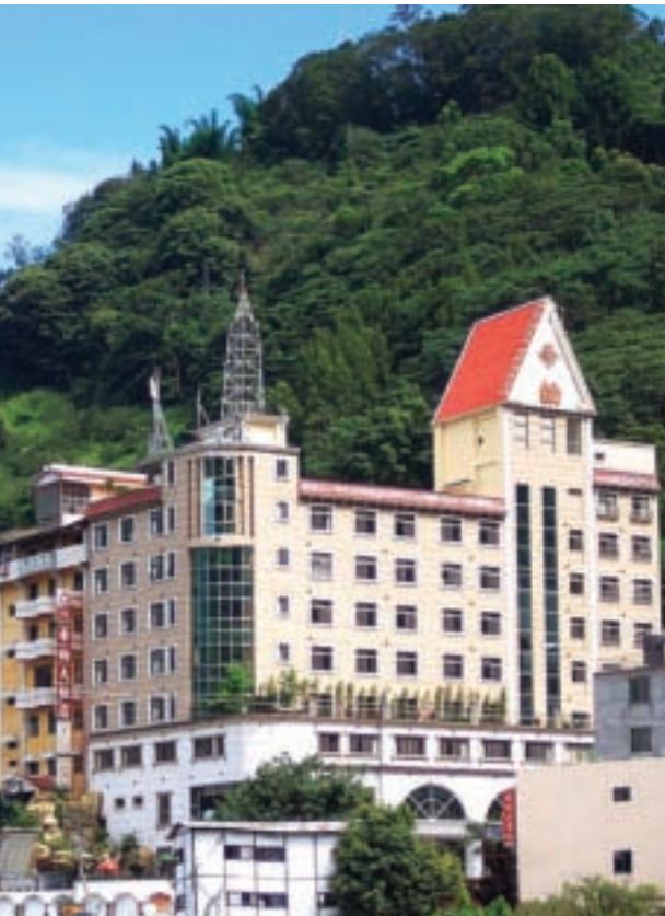
東埔帝綸溫泉大飯店 壯麗外觀

東埔，夙以溫泉聞名，有「溫泉鄉」的美譽。泉質透明、無色、無臭，可供沐浴、飲用。由於位在陳有蘭溪溪畔，郡大山、望鄉山的山腳下，對面則是玉山北峰尾稜，成為季風氣流的屏障，因此，四季如春，氣候宜人。