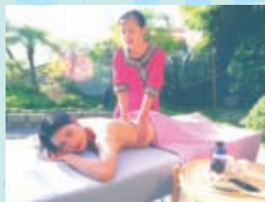
日本浪越指壓服務