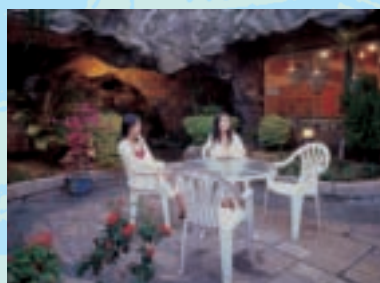
帝王秘湯外的空中花園