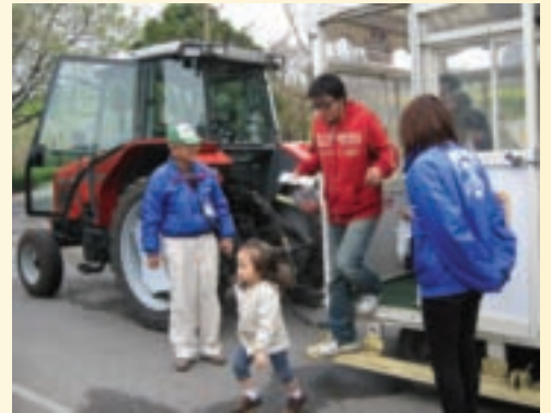
曳引機拖兩個車廂載遊客，有服務人員隨行