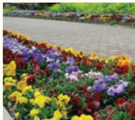
花兒朵朵開，到處是美景