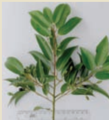
外觀很像土肉桂的陰香

近幾年冒充原生土肉桂的外來假肉桂「陰香」，已堂而皇之地種植於台灣各地。為了辨別真偽，農委會林業試驗所已研發出快速鑑別土肉桂和陰香的方法，提供民眾辨別。