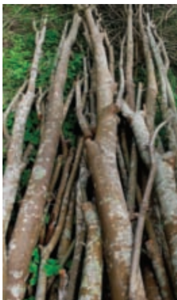
砍下的土肉桂株幹也有利用價值