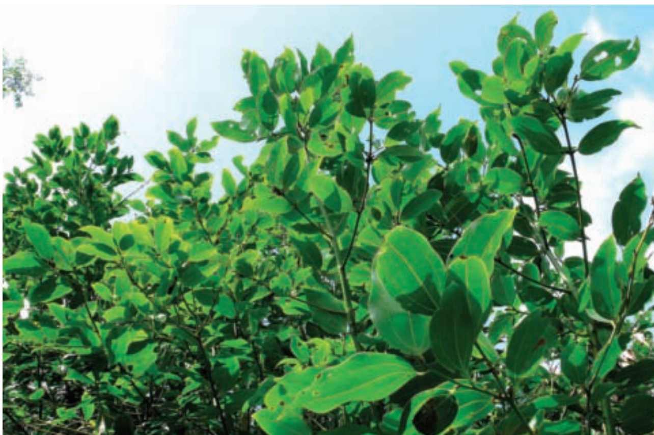
土肉桂是台灣特有樹種