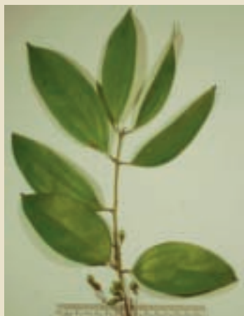
台灣原生的土肉桂