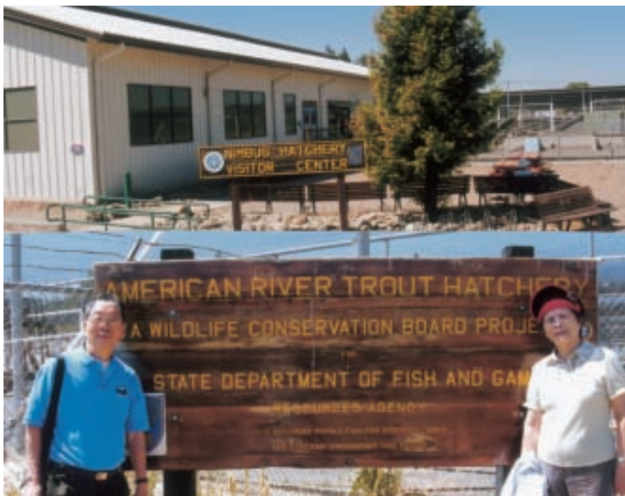
加州州政府 (DFG) 所經營的野生鱒魚及鮭魚人工孵化養殖場，開放參觀

加州共有14個由州政府所辦的野生魚苗孵化場，有老的，也有新的，平均起來有62年歷史。筆者所參觀的沙克拉門度孵化場於1965年啓用，至今已42年，占地約2公頃，規模相當大，除了展覽室、魚卵孵化室之外，還有魚病防治研究