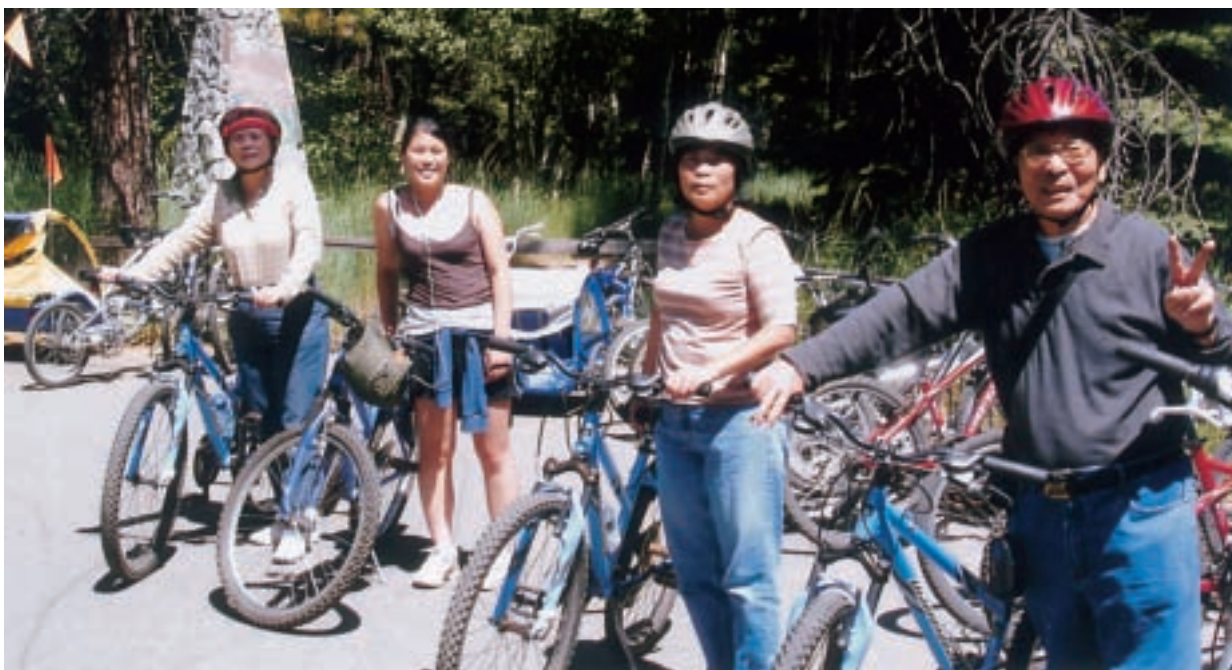
大浩湖是度假勝地，祖孫三代享受騎車環湖之樂

台灣養殖漁業發達，以水產養殖王國享譽國際。筆者曾在外交部所屬海外會及國合會服務7年，每年與水產試驗所及海洋大學共同辦理水產養殖訓練班，把我們的水產養殖技術轉移給來台受訓的中東、非洲、中南美洲等友邦的學員，以鞏固邦交。筆者也多次前往沙烏地阿拉伯、巴林、厄瓜多、薩爾瓦多、南非及印尼等友邦，了解台灣養殖技術在當地落實的情形。沙國及南非的農部次長曾經對我說，他們認為台灣的水產養殖（包括育苗技術）是世界第一，要我們繼續協