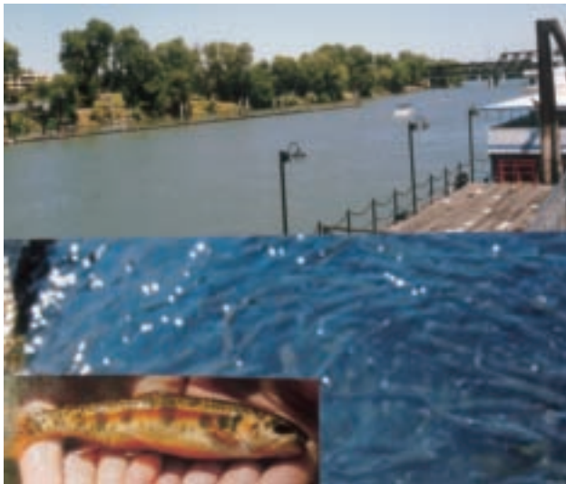
美國加州沙克拉面度河中所放流的鱒魚