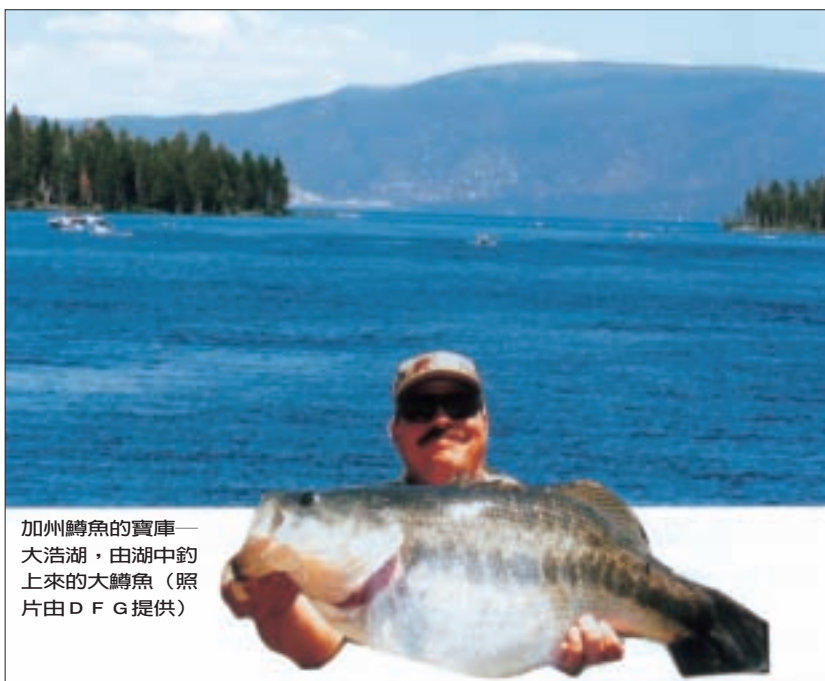
加州鱒魚的寶庫——大浩湖，由湖中釣上來的大鱒魚

魚讓釣客享受垂釣之樂。根據加州法律(2008)，65歲以上的加州住民要向有關單位購買每次6美元的釣魚許可證。有證件的殘障人士及當地印地安人及16歲以下的小孩，不用釣魚許可證也可以釣魚。外地人每人每年則要付856美元(夫婦兩人則要付1,502美元)才能拿到釣魚許可證。根據法律規定，只能把釣到的大魚帶回去，小魚必須放回在湖中，否則被巡邏員抓到會處以重罰。著重保育的法律與魚苗的流放，讓河川的自然資源得以獲得保護而一直延續下去。