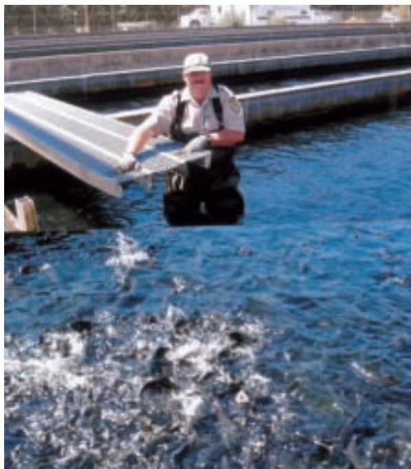
加州政府所經營的各種野生鱒魚、魚苗在養殖池爭食跳躍。照片中快樂的養殖人在此工作已30年

看到魚池內健康可愛的小魚爭食跳躍的景象，深感興奮。想到原來是一顆小小的魚卵竟孕育出新生命，在河川湖泊長大後又開始產卵，新生命誕生，自己則因老化而死亡，如此週而復始、生生不息已經反覆了好幾百年、好幾千年，甚至好幾萬年。所有的生物包括動、植物及人類