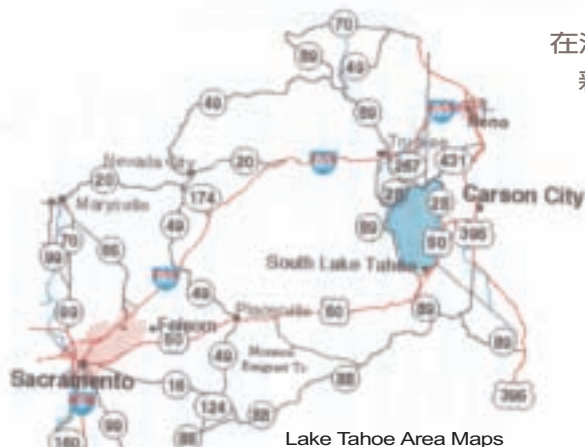
Lake Tahoe Area Maps

在沙克拉門度縣的鱒魚及鮭魚孵化育苗場裡，新生命的誕生與成長，令人不禁讚嘆大自然的奧妙。加州政府重視保育法令以及廣設野生魚苗孵化場，造就豐碩的環保成果，不僅讓住民輕鬆享受垂釣之樂，也讓自然資源得以獲得保護而生生不息。