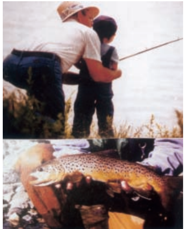
加州人的釣魚樂

台灣在高山上養殖鱒魚，在平地養殖香魚、鰻魚、石斑魚、虱目魚及吳郭魚。大部分是將稻田改建成魚池，利用抽取的地下水養殖，因而造成地層下陷。台灣雖然可以培育各種魚苗出口賺外匯，但因為河川污染嚴重，魚兒不能生存，能如美國加州一樣放流到河川及湖泊的不多，期待有關單位能儘速整治台灣河川污染問題，也能像