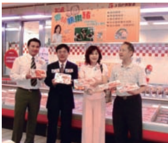
雲林縣長蘇治芬(右二) 6月26日與農業處處長呂政璋(左) 於台北市愛買大直店舉辦雲林快樂豬上市記者會

具 有產銷履歷、無藥物殘留、安全環保豬舍飼養、地方情感品牌認同及聽音樂長大，五大要件的健康豬肉—「雲林快樂豬」正式打通量販市場。在蘇治芬縣長的見證下，快樂豬達人與愛買簽訂了全國上市合約，愛買有信心在一個月內可以在全國賣店系統創