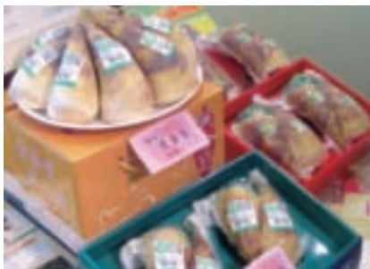
觀音山地區出產之綠竹筍