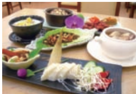
準園的綠竹筍套餐