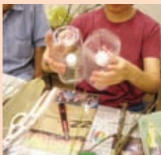
2. 2個寶特瓶前後交叉，利用雙面膠黏著