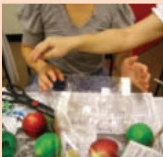
3. 外面包一張玻璃紙