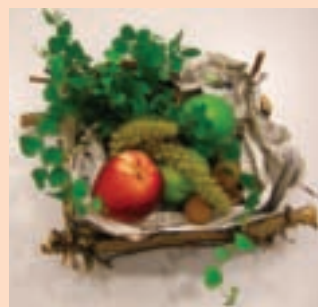
10. 薜荔放入後，加入色彩豐富的檸檬、桃子、龍眼等，加上小米更加豐富