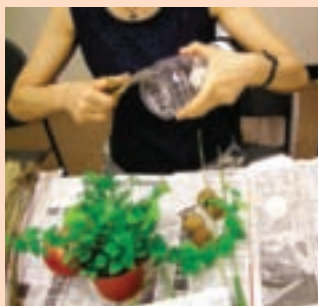
1. 寶特瓶（2個）剪下一長型洞