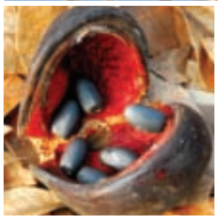
果實內有數粒種籽