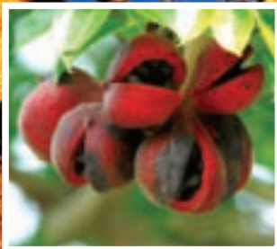
枝上成熟果實已裂開